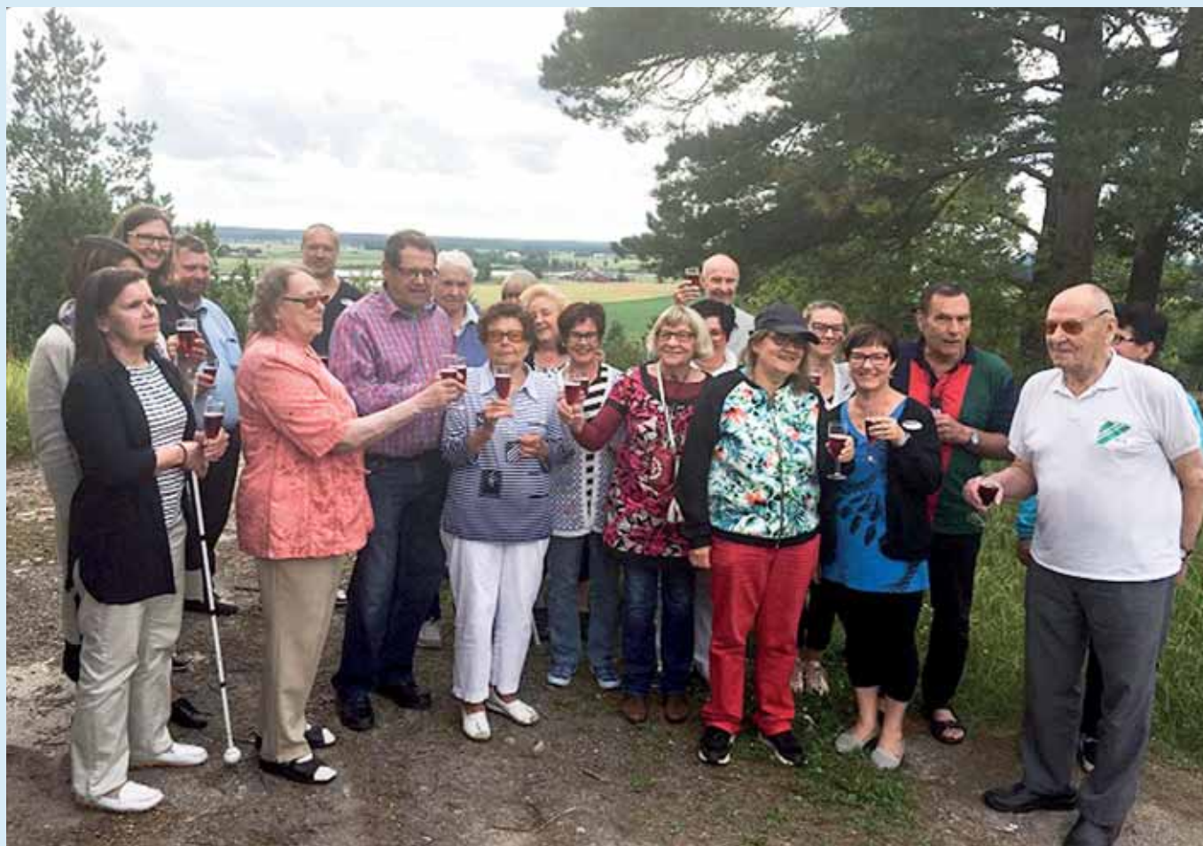
Eläköön Suomi ja kerho.

alkoholittomat mansikkakuohuviinit. Skoolasimme 100 vuotta täyttävälle Suomelle ja 30-vuotiaalle Satakunnan kuurosokeiden kerholle.