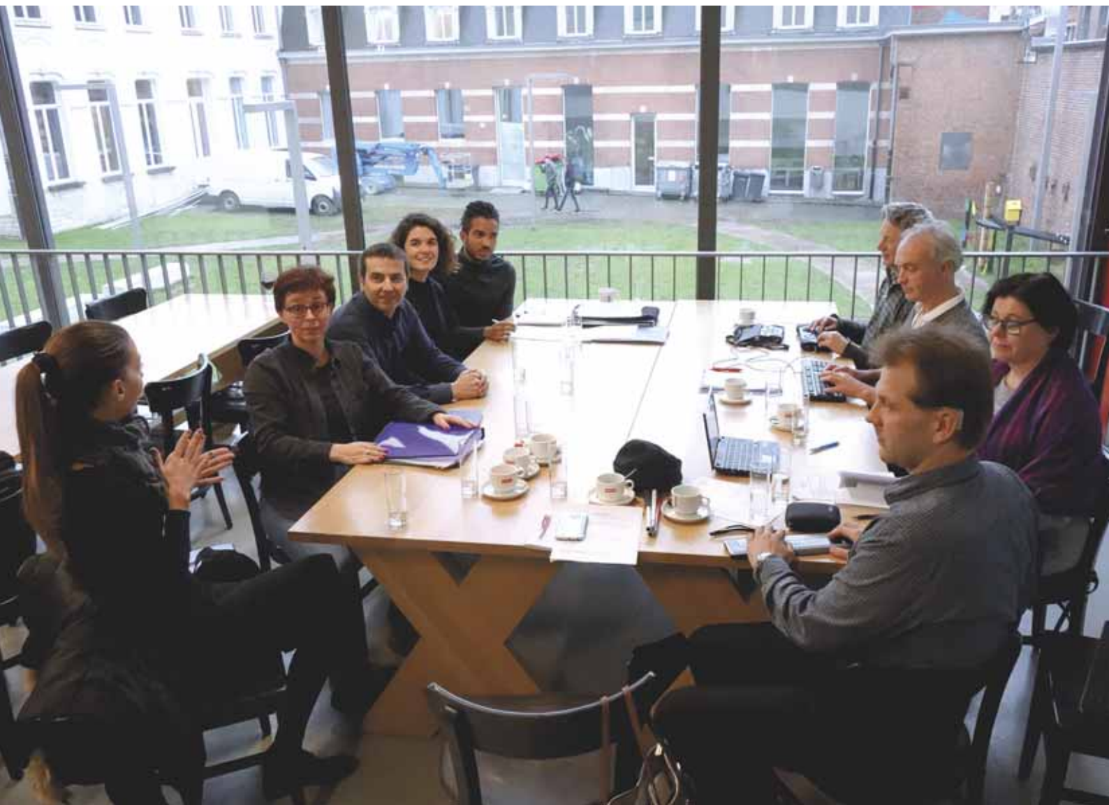
Museo M, Leuven, Belgia.

kansainvälinen Helen Keller -konferenssi, jonne kokoontuu satoja kuurosokeita eri puolilta maailmaa.