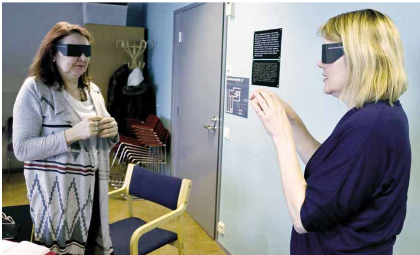
Kapeaan näkökenttään viittomisen harjoittelua.