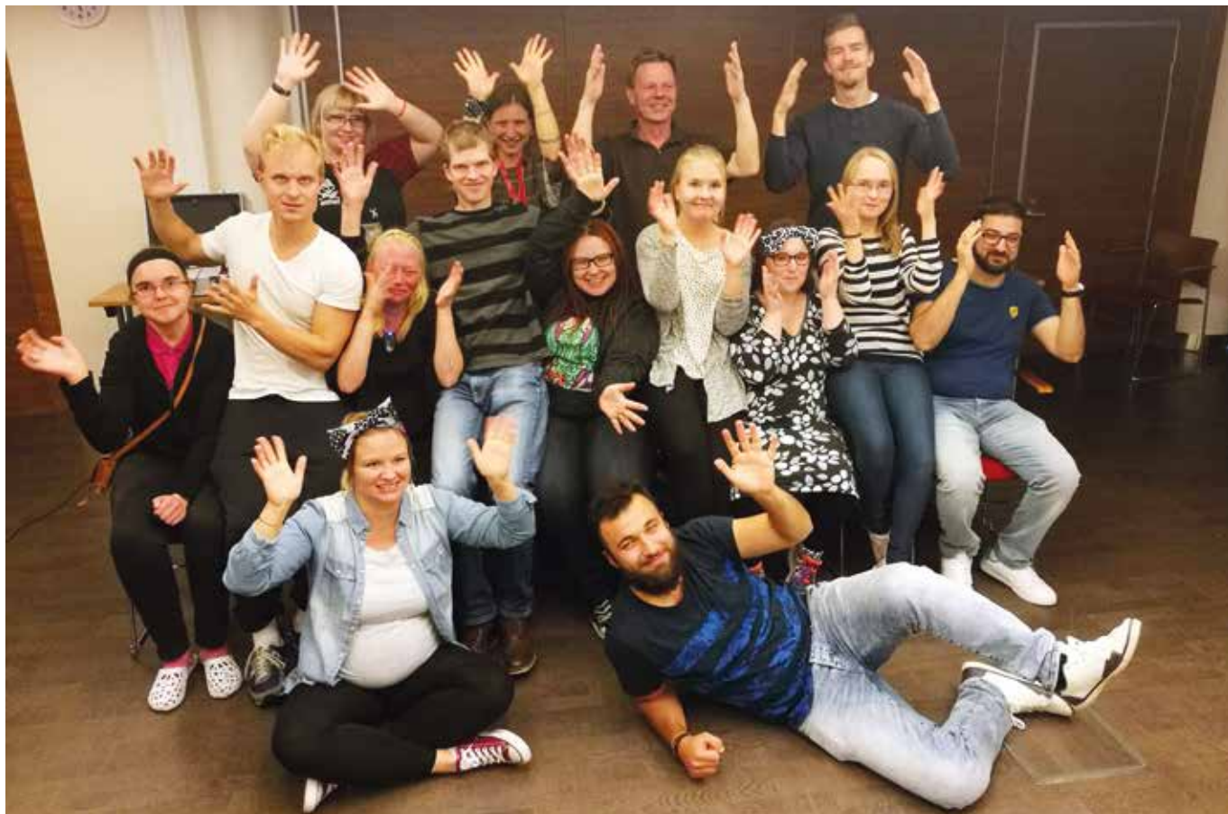
Ryhmäkuvassa nuorten tapahtuman osallistujia.

Teksti: Johanna Rytönen