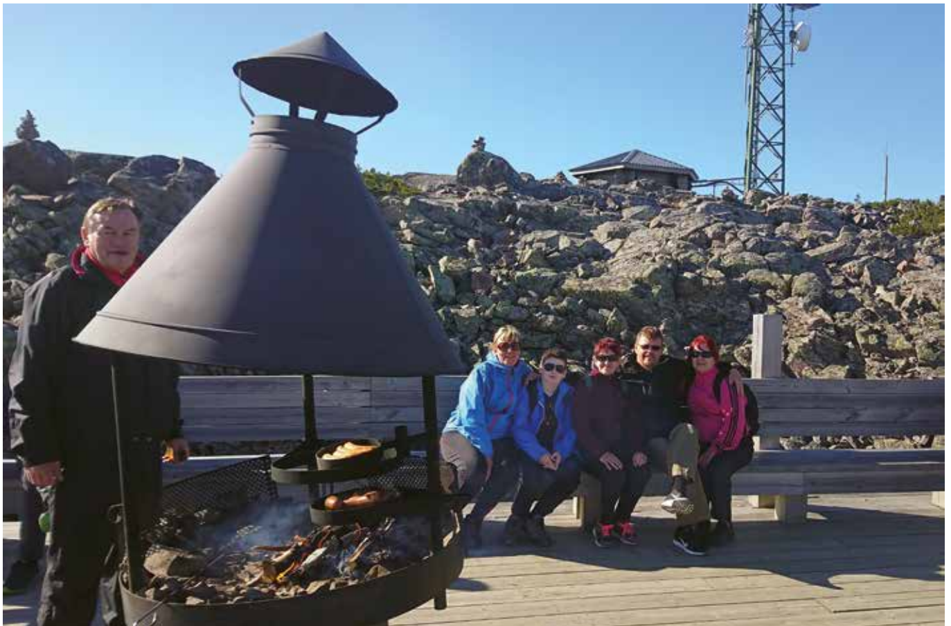
Levin huipun nuotiopaikalla retkelle osallistujia.

Perjantaina vaelsimme Kätkätunturille. Porukan nuorin vuokrasi pyörän, mutta hän ei voinut sillä ajaa, koska maasto oli niin haasteellinen. Kävelimme kohti huippua. Korkealla olikin kova tuuli. Ruska näkyi mahtavasti, oli punaista, keltaista ja oranssia. Alaspäin oli haastava mennä. Meidän piti liikkua varoen,