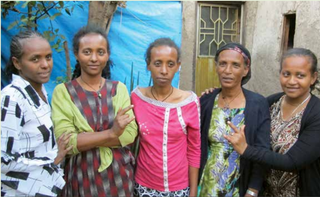
Neljä kuulovammaista sisarusta äitinsä kanssa.

tuneesta projektista. Abilis-säätiö myönsi reilut 2000 euroa kyseiselle leipomo-projektille. Kymmenelle nuorelle opetettiin leivän ja injeran leipomista, ja käytännön liiketaitoja. Työtilat saatiin vuokraamalla, ja työpaikalle hankittiin leipomokoneita ja raakamateriaalia. Kaikille osuuskunnan jäsenille riittää töitä.