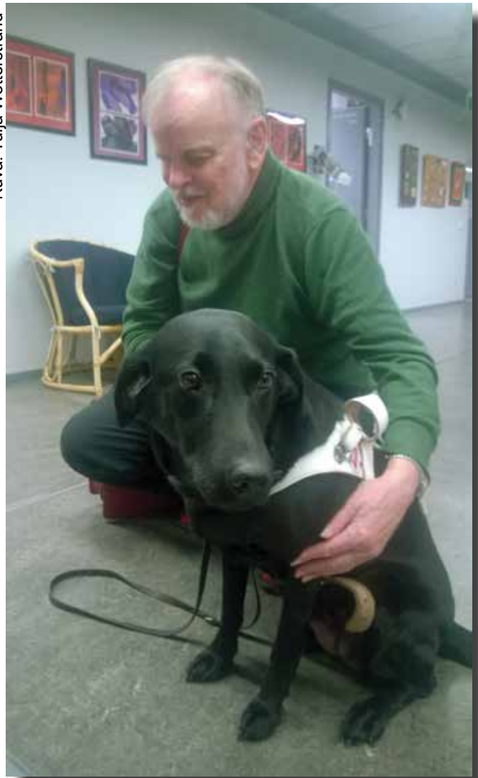
Peppi ja pappi.

vaate, silloisella opas Felbillä työtakki eli valjaat.