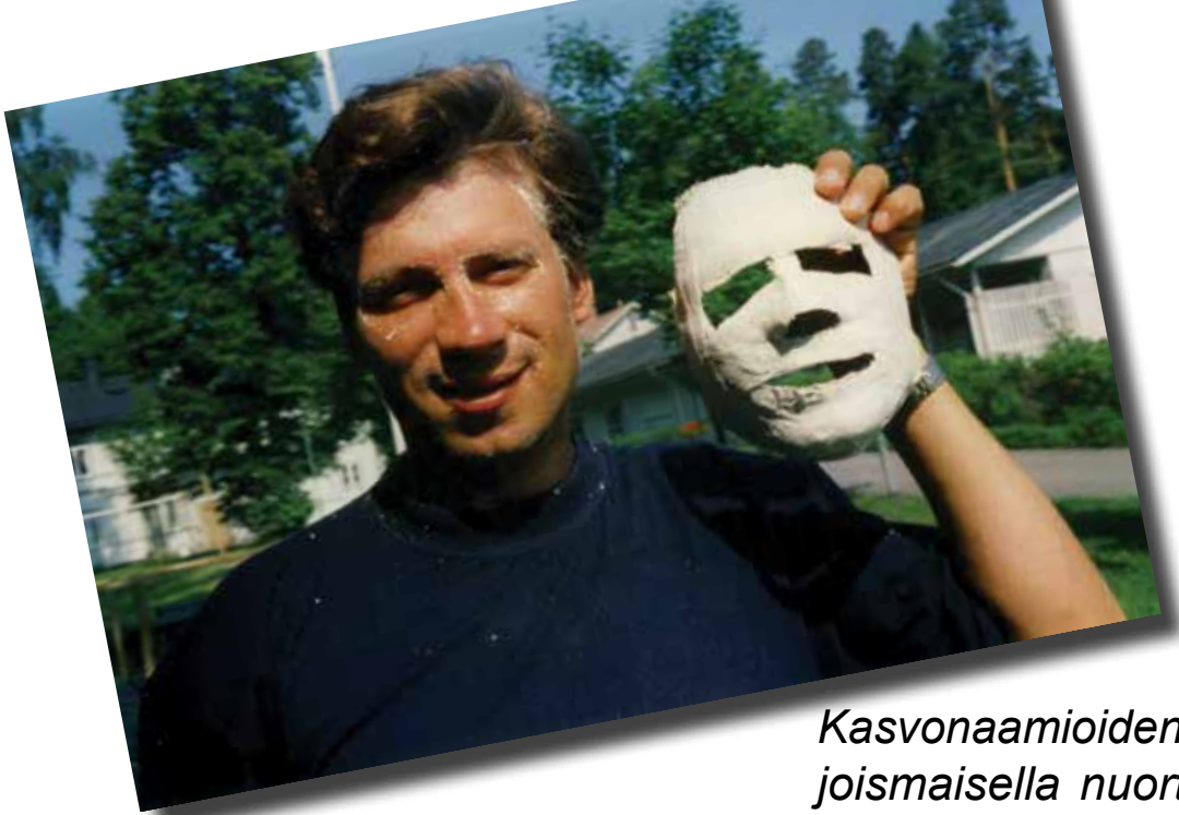
Kasvonaamioiden valmistusta Pohjoismaisella nuorten leirillä.

hoitivat itse hevosia. Teimme itse ruokaa päivisin ja illalla syötiin eri majapaikoissa. Aamuisiin haimme hevoset laitumelta ja valjastimme ne vankkurien eteen. Oli tosi kiva retki. Paljon koettiin ja nähtiin.