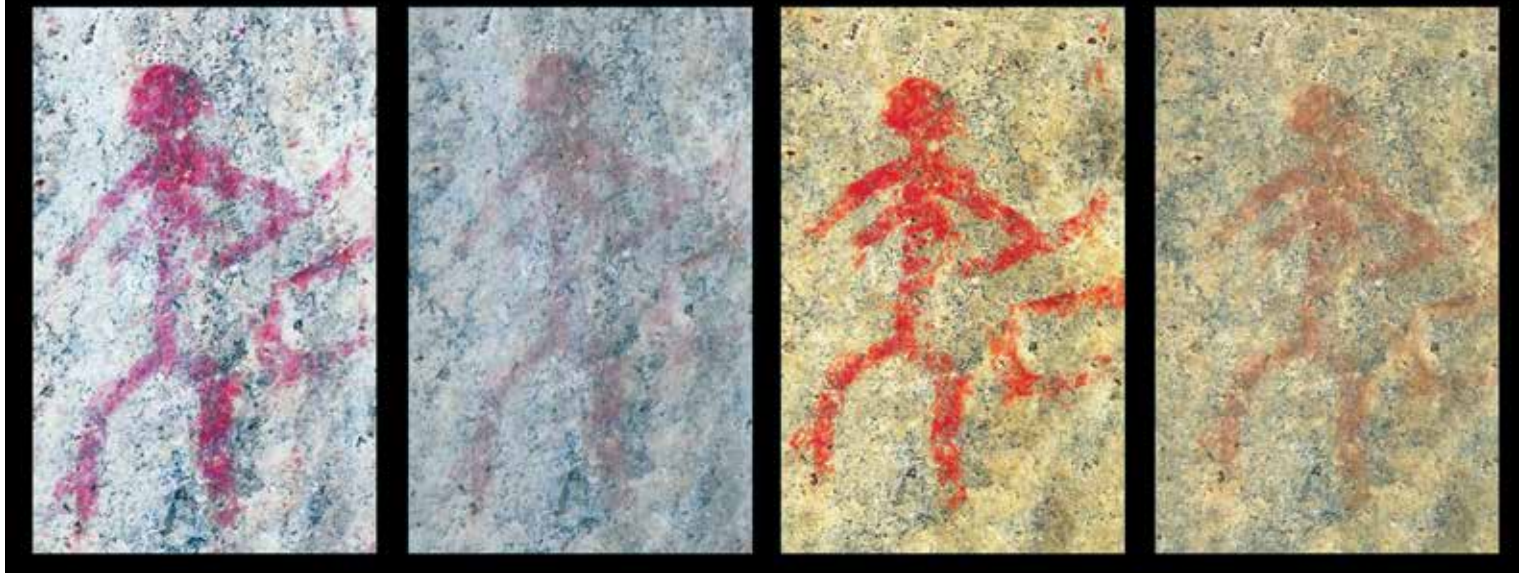
Astuvan Artemis Ristiinan Astuvansalmella kuvattuna eri vuodenaikoina. Vasemmalla käsitelty ja käsittelemätön talvikuva, oikealla syksy kuvat. Käsitellyissä kuvissa punaista väriä on korostettu kuvankäsittelyohjelmalla.