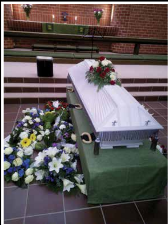
Lähtö viimeiselle matkalle.