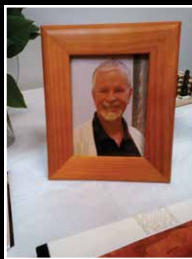
Kari sellaisena kuin hänet muistamme.