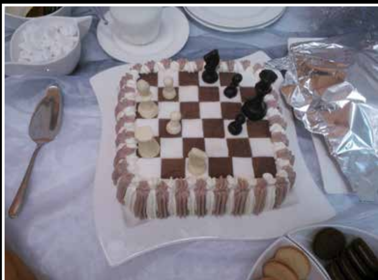
Shakkimestari-Karin näköinen kakku.