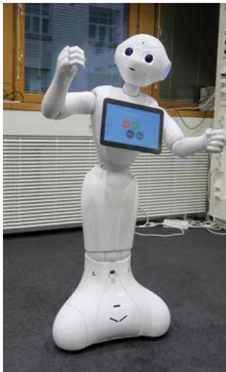
Pepper, sosiaalinen robotti.