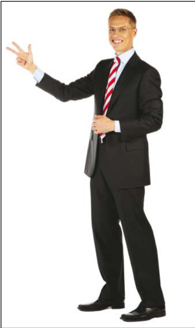
Ulkoministeri Alexander Stubb