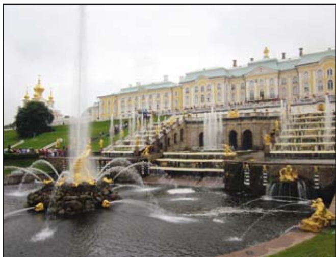
Palatsi- ja puistoalue Pietarhovi.

Kolmantena päivänä matkustimme kantosiipialuksella Pietarista noin 30 kilometriä merelle länteen, Pietarhoviin. Pietarhovin ylpeytenä ovat sen maailmankuulut puutarhat ja suihkulähteet. Pelkästään suuressa suihkulähderyhmässä, jonka rakennustyöt kestivät sata vuotta, on 64 suihkulähdettä ja yli 200 kullattua pronssiveistosta. Sen jälkeen palasimme Pietariin, ja siellä menimme Paavali-Pietarin linnoitukseen.