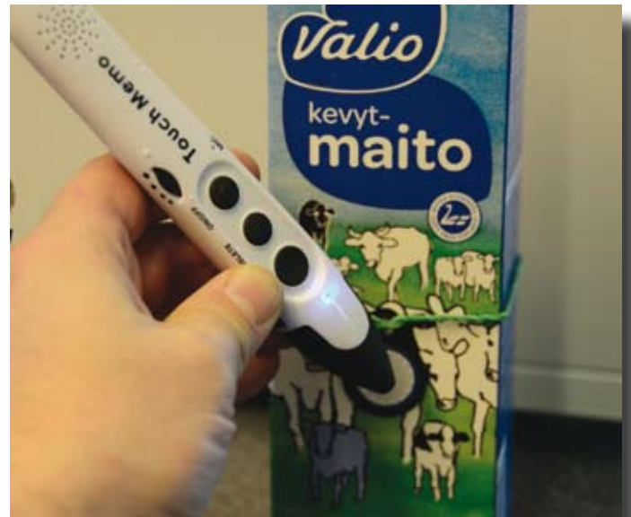
Maitotölkkiin kiinnitettyyn tarraan on äänitetty parasta ennen -päivämäärä. Kun nimiöintilaitteella koskettaa tarraa, laite puhuu äänitetyn päivämäärän.