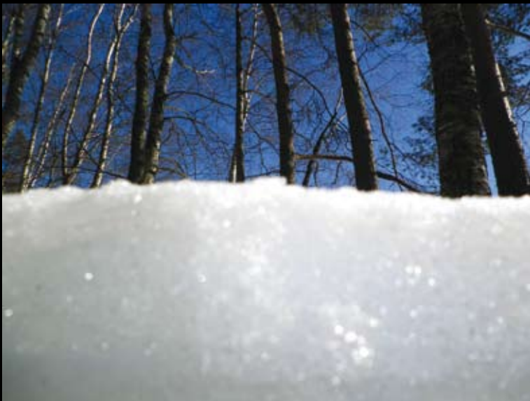
Talvi, Eetu Seppänen