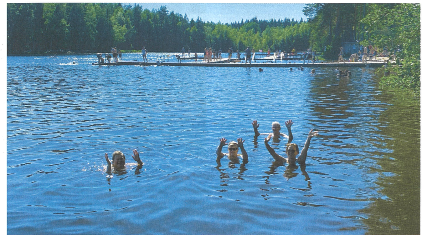
Päivän lopuksi käytiin uimassa.