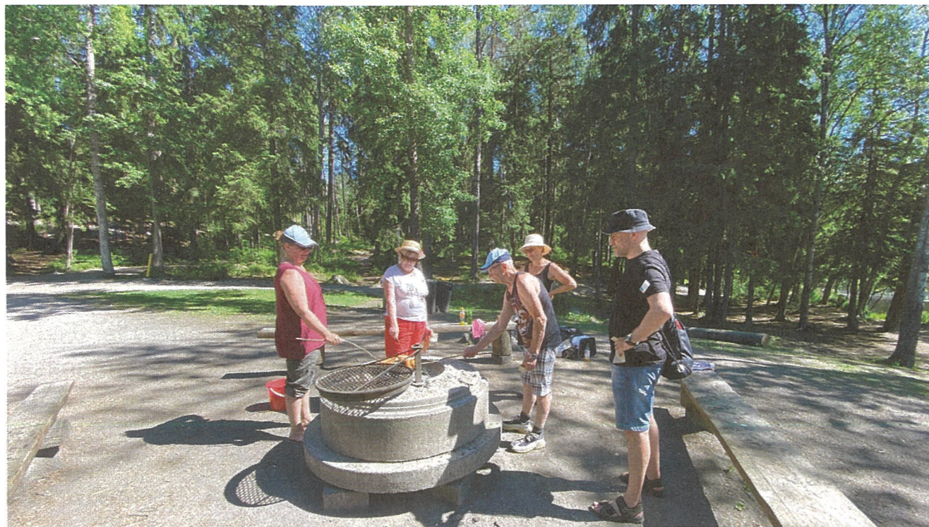
Taukopaikalla pysähdyttiin grillaamaan.

Meillä meni yli neljä tuntia, mutta eipä se haitannut. Pääasia oli, että kaikilla oli hauskaa. On tärkeää, että asiakas voi kohentaa kuntoa, kokeilla uusia asioita ja saa vertaistukea. Yhdessä voi tehdä ja nauraa sekä nauttia kesäisestä luonnosta. ■