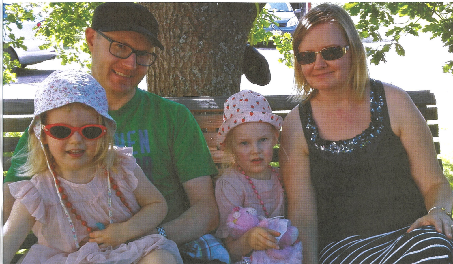
Kesän viettoja perheen kanssa.

Arjessa on paljon yhdessä tekemistä, kuten siivoamista ja ruokakaupassa