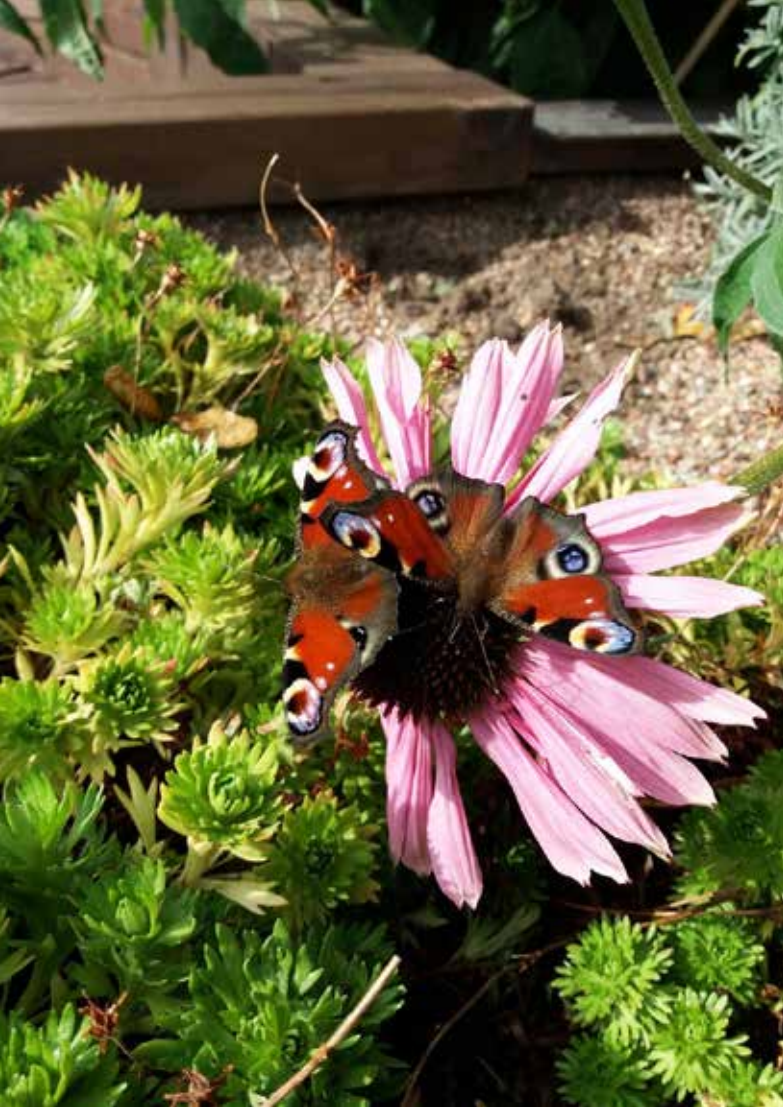
Myös perhoset viihtyvät aistipuutarhassa.