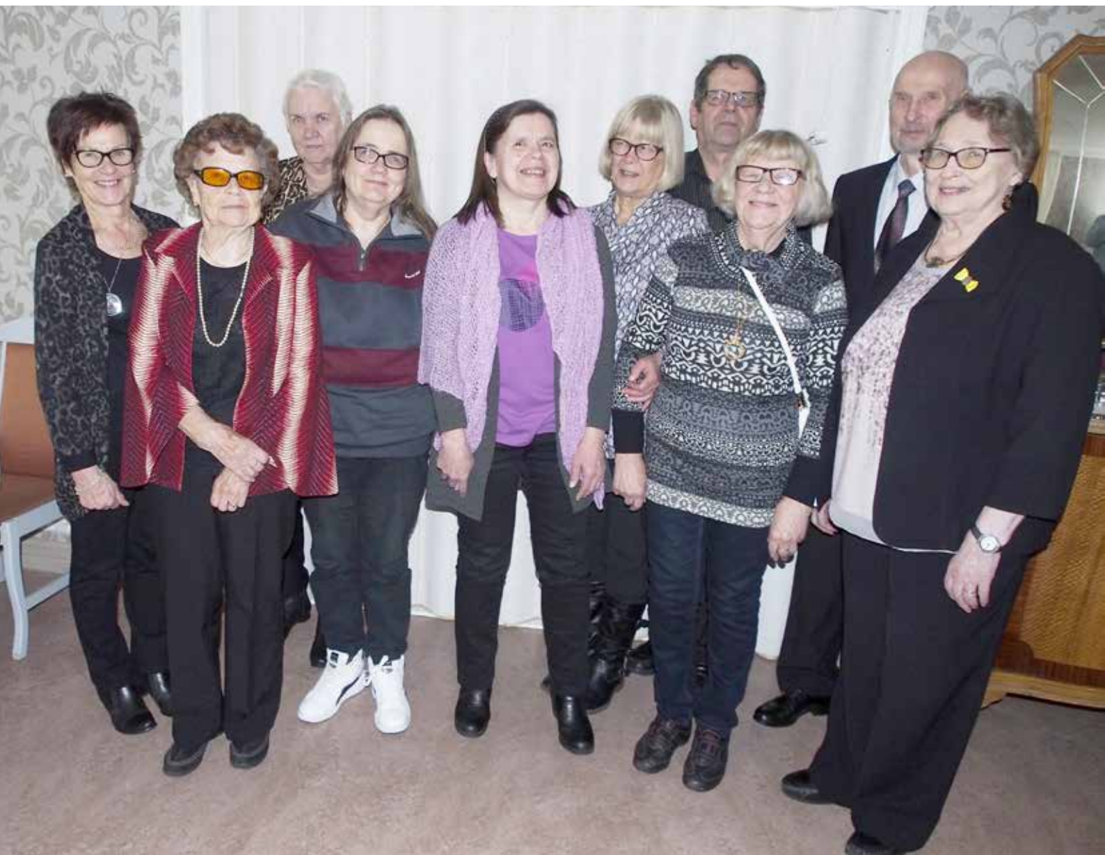
Satakunnan kerhon kerholaisia juhlassa.

hyvä asia on, että kuurosokea pääsee pois kotoa toisten kuurosokeiden kanssa keskustelemaan.” (Lepistö)