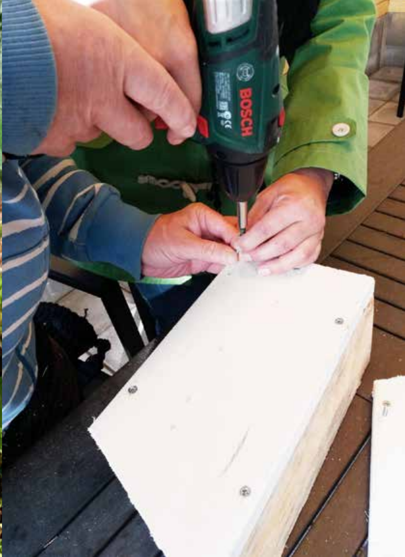
Linnunpöntön ruuvaus onnistuu hyvin.

istutetaan ja kastellaan kasveja sekä korjataan satoa. Samalla nostetaan, kannetaan, kurkotellaan, ojennetaan, käytetään työkaluja ja harjoitetaan hienomotoriikkaa. Mullan, lannoitteiden ja kasvien tuoksu aktivoi sieraimet ja herättää herkäät hajureseptorit. Raikas ulkoilma virkistää, ja toisinaan aurinkokin lämmittää paisteellaan. Puuhaillessa tulee käytettyä lihaksia, joita ei ole viime aikoina muistanut olevan olemassakaan. Nuoruudesta tutut toiminnot liikeratoineen palautuvat myös heikommin muistavien aktiiviseen lihasmuistiin. Tasapaino harjaantuu ja käsien liikkuvuus paranee. Tuntuu, että tekee ”oikeaa” työtä. Mikäs sen mukavampaa.