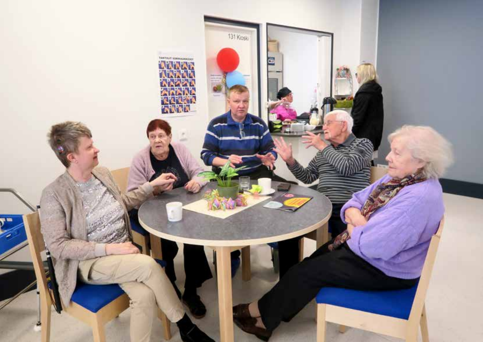
Ryhmäkeskustelua Ristontalon ruokalassa.

”Yhteisissä tiloissa liikkuu paljon ihmisiä ja aina löytyy auttavia käsiä.”