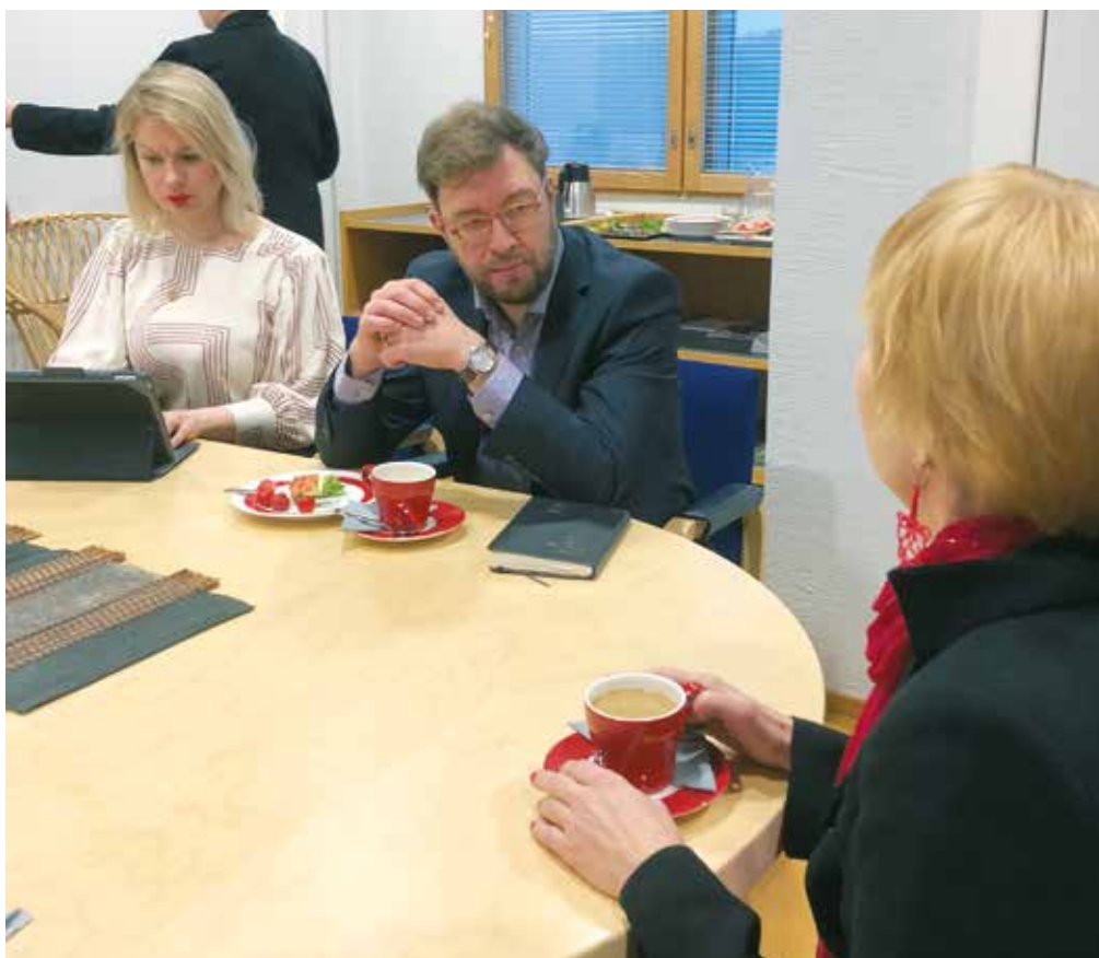
Työministeri Timo Harakka vierailulla li-riksessä.

Ministerin kanssa keskusteltiin pitkään ensimmäisen työpaikan saannin merkityksestä jatkotyöllistymisen kannalta. Ministeri tuntui ymmärtävän muun muassa kesätyöpaikan merkityksen. Samoin keskusteltiin palkkatuesta, jota ollaan uudistamassa, ja sen merkityksestä vammaisten ja osatyökykyisten työllistymisen edistäjänä. ■