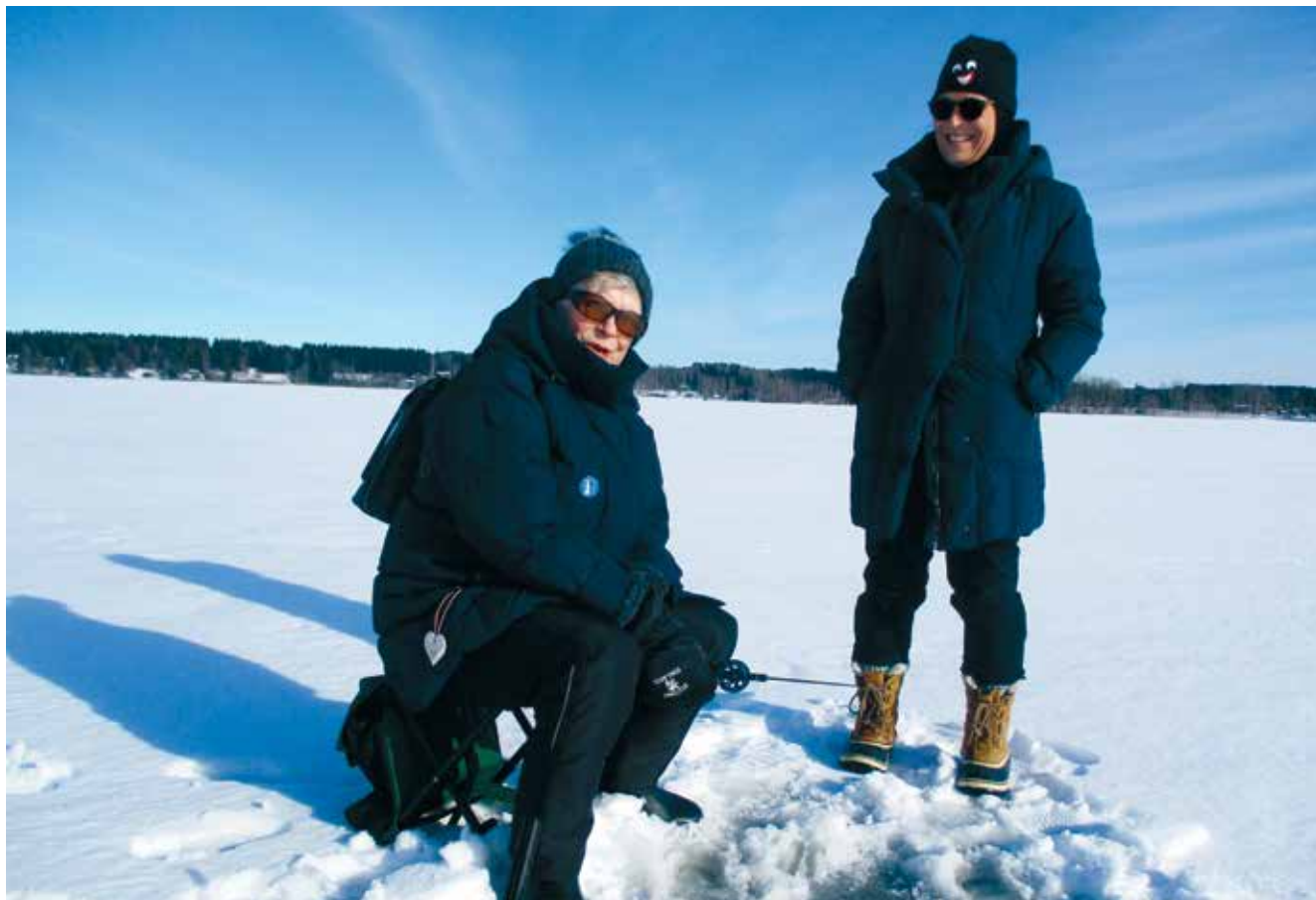
Kuva: Irja Rajalan kotialbumi. Tuntosarvi 4/2020.

Kuvailun vastaanottaja voi ehdottaa hänelle sopivia tapoja eri tilanteissa, siksi on tärkeää opiskella eri mahdollisuuksia.