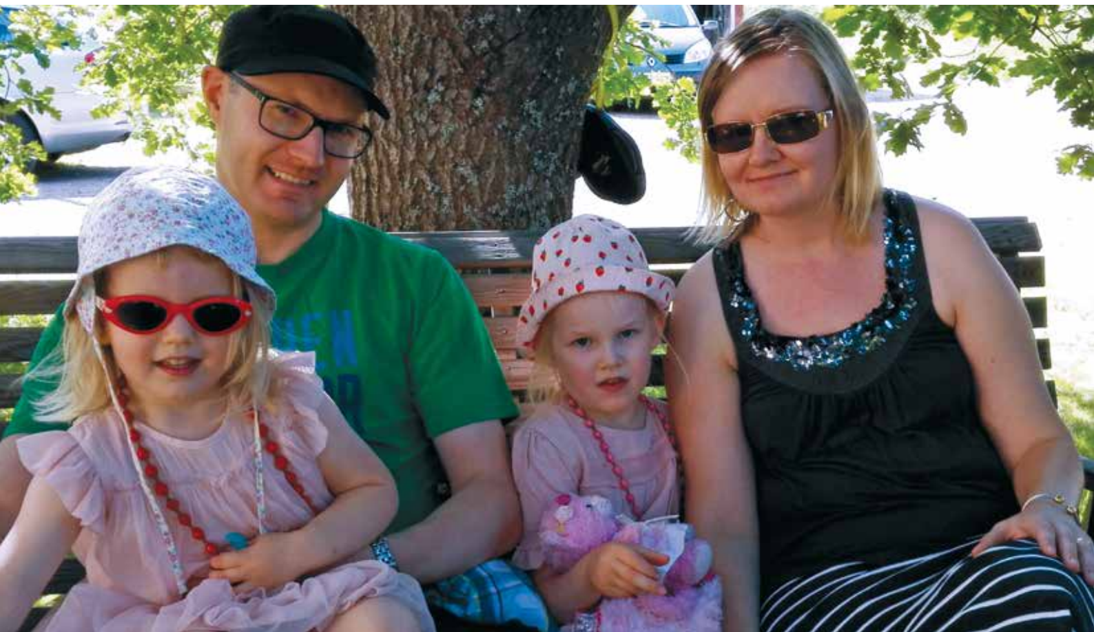
Kesän viettoja perheen kanssa.

Arjessa on paljon yhdessä tekemistä, kuten siivoamista ja ruokakaupassa