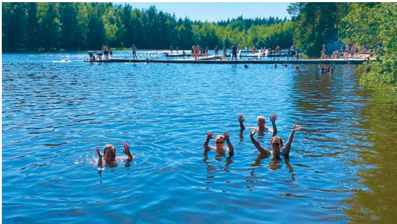
Päivän lopuksi käytiin uimassa.

Meillä meni yli neljä tuntia, mutta eipä se haitannut. Pääasia oli, että kaikilla oli hauskaa. On tärkeää, että asiakas voi kohentaa kuntoa, kokeilla uusia asioita ja saa vertaistukea. Yhdessä voi tehdä ja nauraa sekä nauttia kesäisestä luonnosta. ■