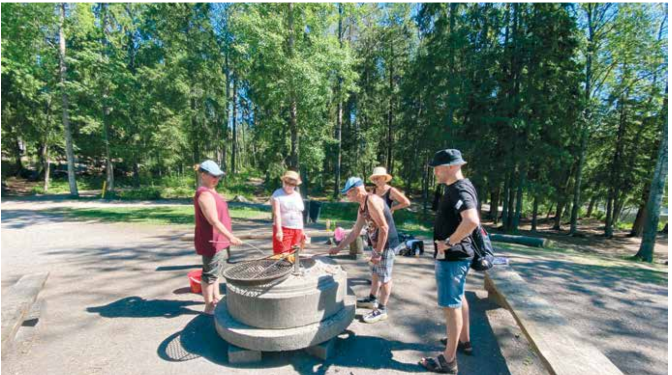
Taukopaikalla pysähdyttiin grillaamaan.

Lenkillä Jaana kävelee ensimmäisenä, ja hän kertoo tarinoita esimerkiksi