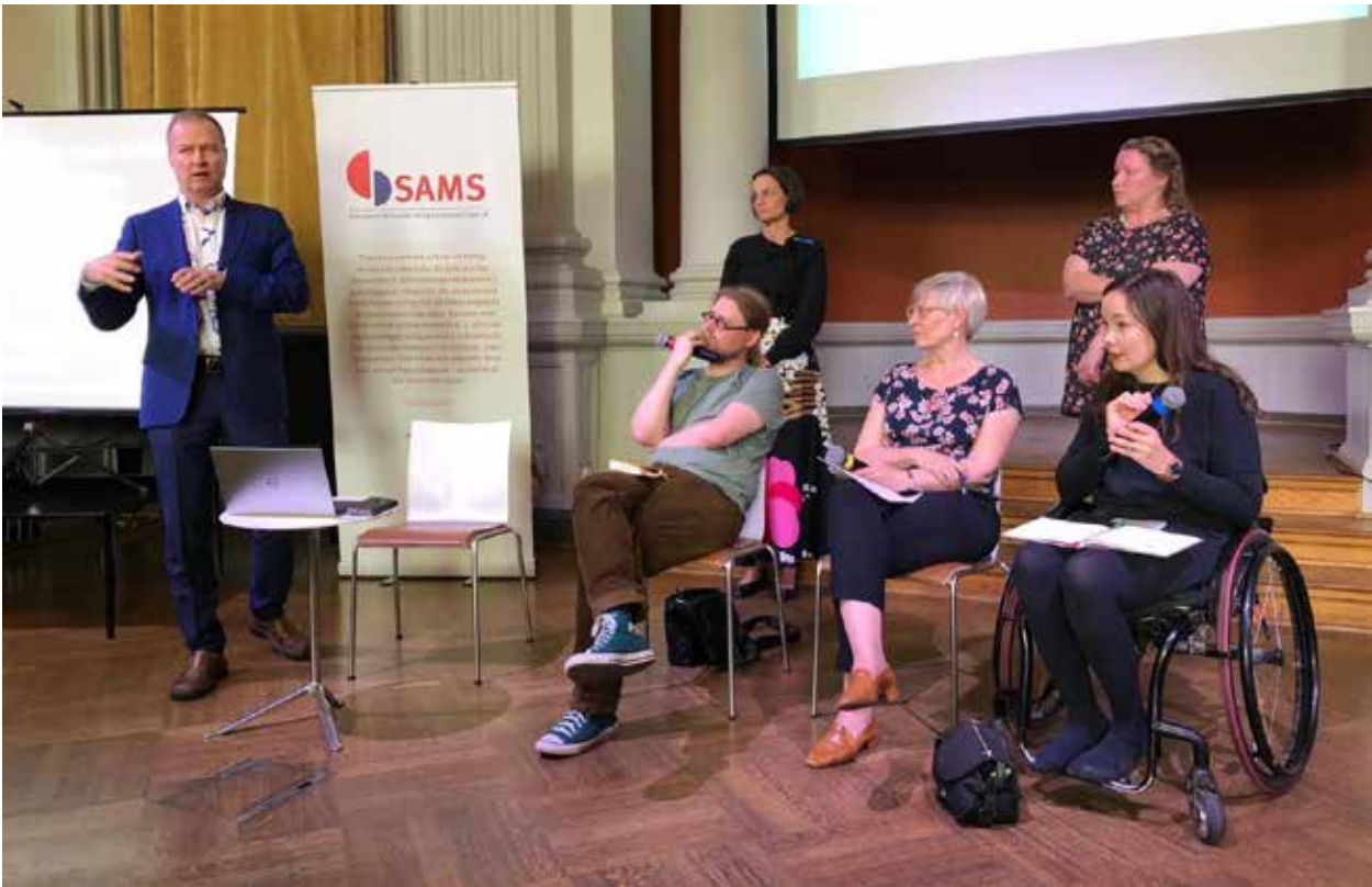
Vammaisfoorumin seminaarin lopussa oli antoisa paneelikeskustelu.