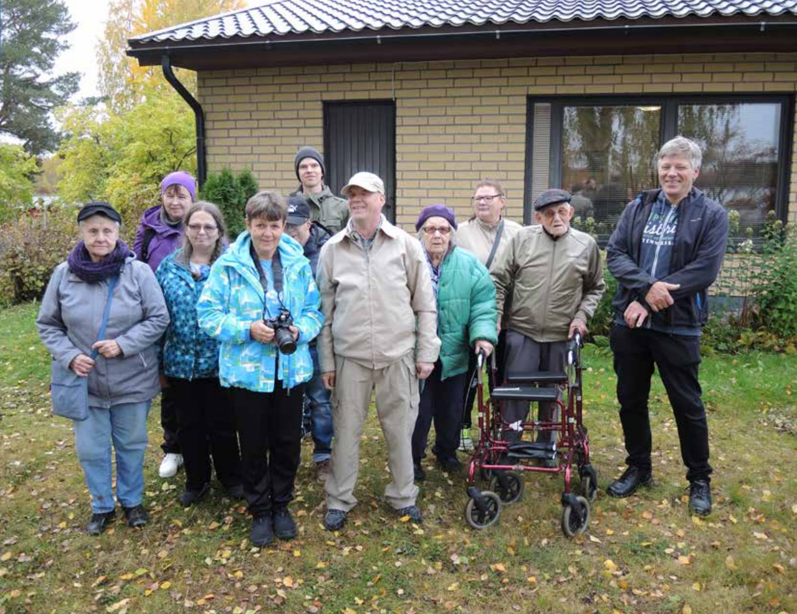
Tutustumassa Suomen Kuurosokeat ry:lle lahjoitettuun kiinteistöön.

"Useat kuurosokeat ja työntekijät antoivat ideoita mökin ja alueen viimeistelyyn. Havaittavissa oli yhdessä suunnittelemisen ja tekemisen iloa."