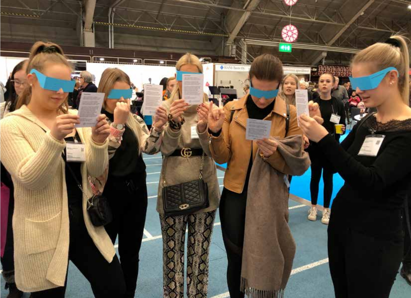
Sosiaali- ja terveydenhuoltoalan opiskelijat kokeilivat putkinäkölaseja Apuvälinemessuilla.

suunnittelun vuoden 2020 nuorten suurleiristä. Verkoston yhteisponnistus oli myös Kaus-tisen kansanmusiikkijuhlien kuulovammapäi-vä, jossa kokoonnuimme yhteiseen esittely-teltaan jakamaan tietoa.