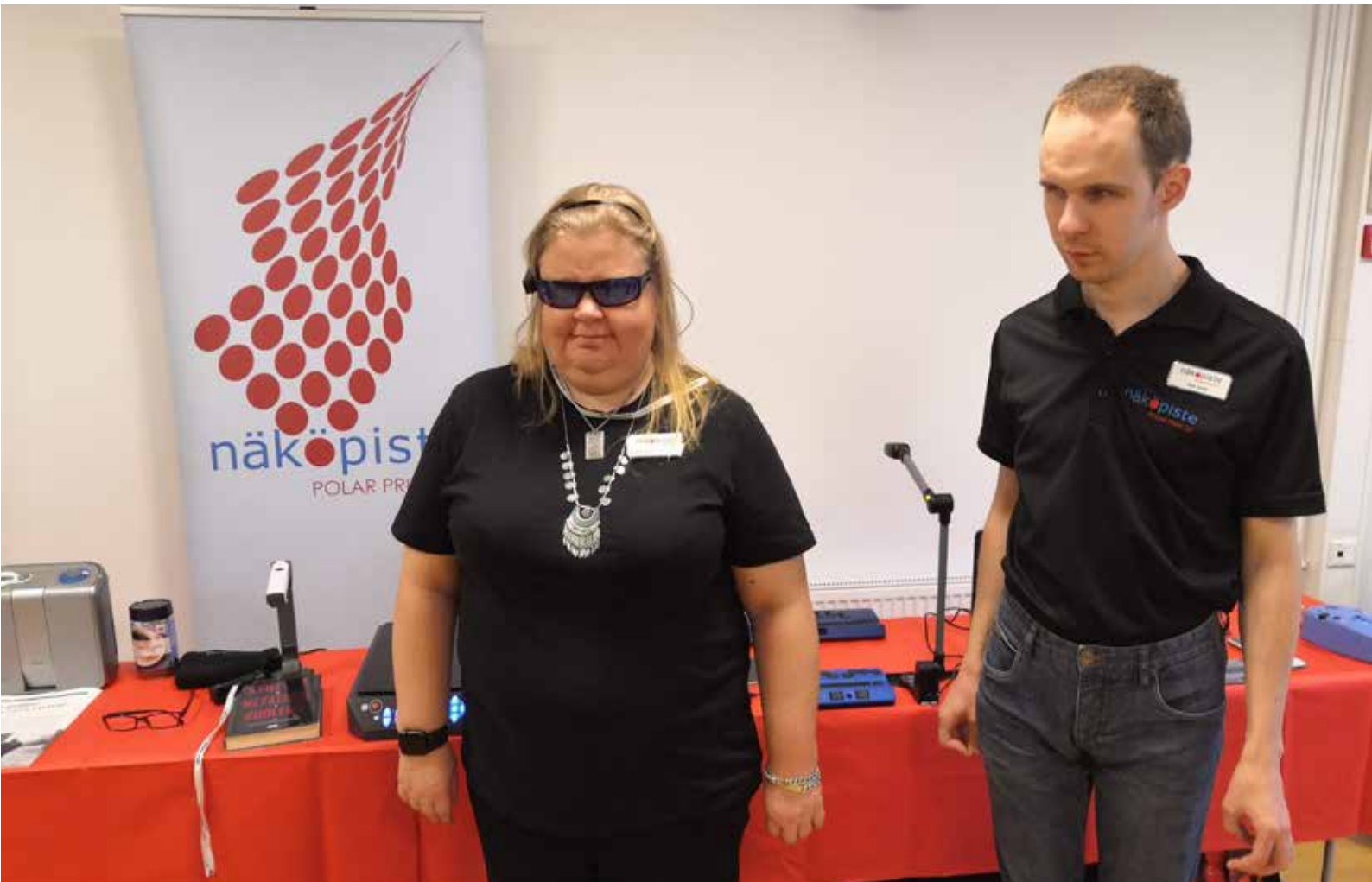
ICT-torit aloittivat tauon jälkeen uudelleen. Kuvassa yhteistyökumppani Polar Printin edustaja.

"Piirien tavoitteena on toimia vertaistuellisesti, jolloin kouluttajan rooli on pääosin vain olla tukena ja ohjata toimintaa."