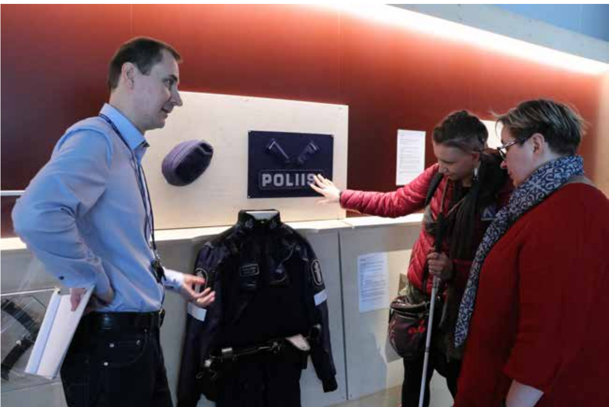
Poliisimuseossa konsultoitin esteettömyysasioissa. Kuvassa kosketeltava seinä.