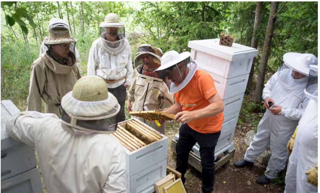
Kouluttamassa uusia osaajia mehiläishoitoon.

Aikuisiällä kiinnostus heräsi mehiläishoitoon. Tämä on periytynyt jo hänen isovanhemmiltaan ja isältään. Hoikkanen päätti lopulta ottaa veljensä kanssa suvun mehiläishoidon käsiinsä. Harrastus kuitenkin vakavoitui, ja hän päätti tutustua mehiläisrotu- ja linjajalostuksen saloihin. Pian