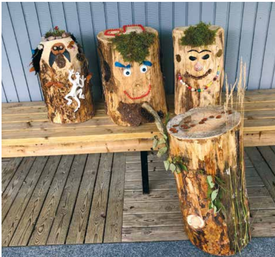
Kuvamuisto. Nuorten leirillä valmistuneet toteemit.

15.10. Valkoisen kepin päivä 22.10. Euroopan kuurosokeiden päivä 9.–15.11. Sokeain viikko 3.12. Kansainvälinen vammaisten päivä 6.12. Suomen Kuurosokeat ry 49 vuotta ■