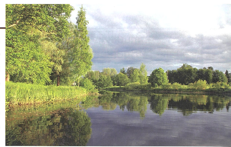
Lapuanjoki upeassa iltta-auringossa opiston rannasta kuvattuna.