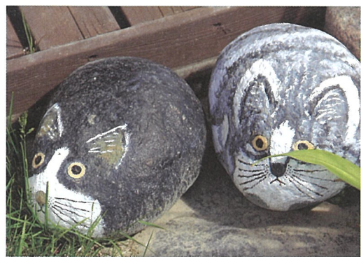
Savipaja Lintukodon lemmikit

Lounaan jälkeen lähdimme kimpakyydeillä retkelle Savipaja Lintukotoon tekemään löytöjä sekä tuha-