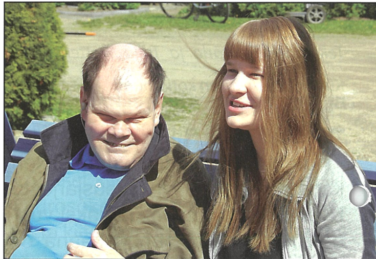
Jaapekan ja viittomakielen ohjaajan tyytyväisiä ilmeitä.