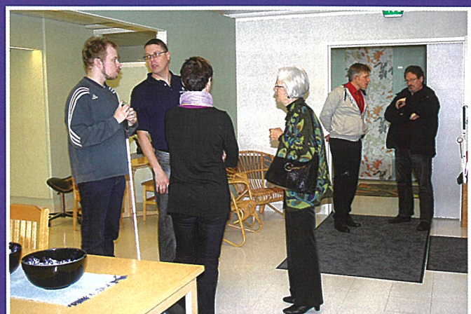
Henkilökunnan ja kutsuvieraiden vilkasta ajatustenvaihtoa. Vieraat kiittelivät uusia tiloja viihtyisiksi, valoisiksi ja esteettömiksi. Kaikin puolin kuntoutukseen sopiviksi.