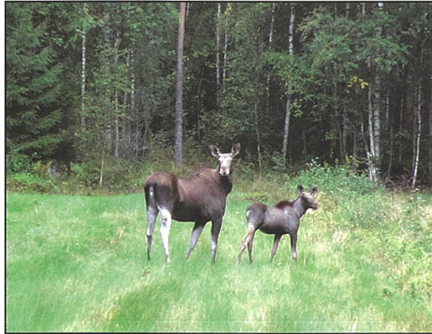
Hirviemo ja vasa Puumalassa viime elokuussa. Hirvien kantaa säädellään suunnitellulla metsästyksellä. Hirven metsästys on luvallista ja luvanvaraista syyskuun viimeisen lauantain ja 31. päivän joulukuuta välisenä aikana.

Metsästyskauden alussa hirvenmetsästysporukka pyysi maatilan omistajalta lupaa ampua maatilan metsissä. Hirvenmetsästysporukkaan kuului 10-12 henkeä. Poliisilaitok-