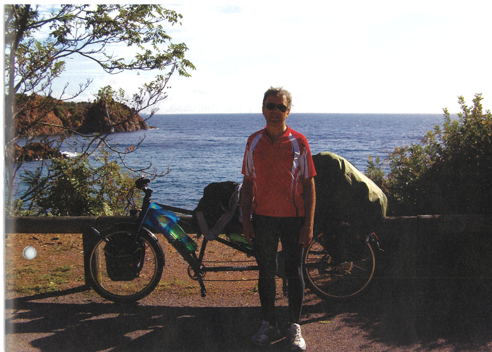
Ranskassa pyöräilyreitti kulki kauniiden vuoristomaisemien ja merinäkymien keskellä. Taukopaikkana tällä kertaa vuoristokaupunki Kasis.

Monaco on niin pieni maa, ettei sitä huomaa missä se alkaa ja mihin päättyy. Sen kaduilla liikkuu iso määrä upeita ja kalliita autoja, kuten Lamborghinija, Ferrareita, Porscheja ja Bentlejä. Poliisi vartioi Monacon kaduilla skoottereilla. Heti kun pysähdyimme tarkistaaksemme oikean reititimme läppäristä, ajeli yksi poliisimies viereemme. Saattaa olla, ettemme herättäneet luottamusta pyörän tarakalla olevine isoine reppuinemme.