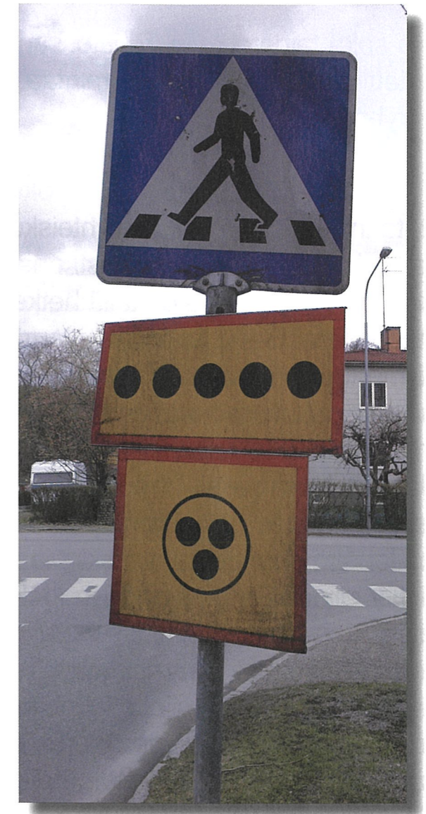
Liikennemerkeissä ylempi keltapohjainen kyltti tarkoittaa sokeita, alaosa kuurosokeita.

Erityisen upeana pidin elämyspuistoa, jonka suunnitteluun ja rakentamiseen myös kuurosokeat olivat saaneet aktiivisesti osallistua. Puistoa