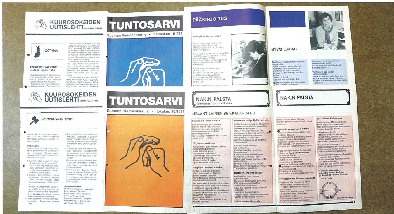
RAY:n rahoituksen ansiosta Tuntosarveen saatiin yksi lisäväri numeroa kohden vuoden 1988 alusta. Tekstiä ja kuvia oli paljon vähemmän kuin nykyisin. Kuurosokeiden Uutislehti ei juuri ole muuttunut vuosien saatossa.

viiden vuoden välein järjestettävä Koskettavin veistos -näyttely.