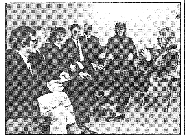
Toiminnan alkua ajoilta

Sosiaali- ja terveysministeriöön perustettiin työryhmä selvittämään kuurosokeiden tilannetta ja palveluiden järjestämistä. Työryhmä ehdotti vuonna 1979, että vastuu kuurosokeiden palvelujen järjestämisestä annetaan heidän omalle järjestölleen.