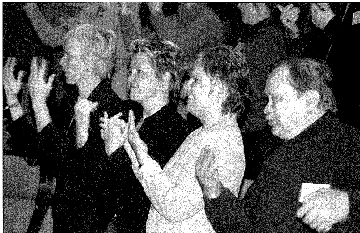
Yleisö eläytyi mukaan Teatteri Törmäyksen avajaisesitykseen.