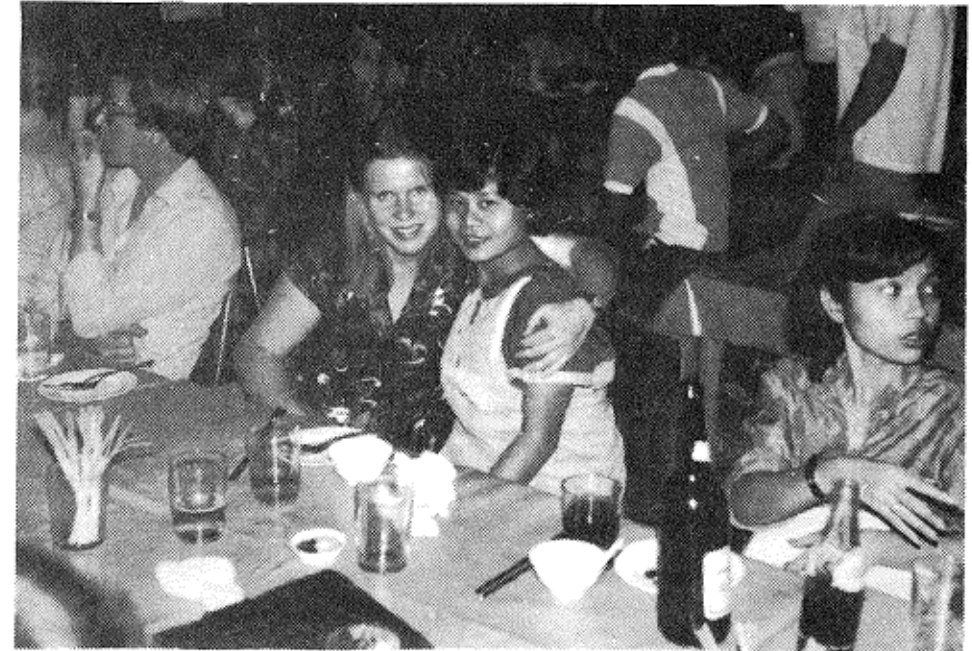
Ystävykset Bangkokin yössä