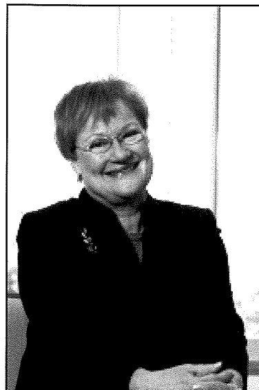
Tarja Halonen Ehdokas numero 9

Suomen tasavallalle valitaan presidentti seuraavaksi kuudeksi vuodeksi sunnuntaina 29.1.2006. Vaalien ensimmäisellä kierroksella kukaan ehdokkaista ei saanut yli puolta annetuista äänistä, joten presidentinvaalista järjestetään toinen vaali. Ehdokkaina toisella vaalikierroksella ovat istuva presidentti Tarja Halonen ja Euroopan investointipankin varapääjohtaja Sauli Niinistö.