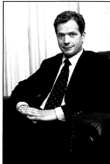
Sauli Niinistö Ehdokas numero 3