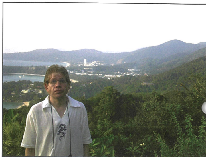
Jouni näköalatasanteella. Taustalla näkyvät Katan ja Karonin rannat. Phuket on erittäin metsäinen saari.

Hotellin niin sanottu amerikkalainen aamiaisen vaikutti ensin melko ras kaalta, sillä itse en ole tottunut syömään lounaspöydän kaltaisia ruokia aamuisin. Pian kuitenkin elimistö tot-