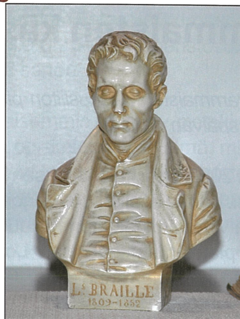
Louis Braillesta tehty rintakuva Näkövammaismuseossa liriksessä.

Pariisiin oli perustettu sokeiden lasten koulu jo 1700-luvun lopulla, mutta Louis laitettiin aluksi näkevien kouluun. Kun hän ei oppinut siellä kirjoittamaan eikä lukemaan, teki isä kirjaimia pyöreäkantaisista nauloista puupölkkyihin,