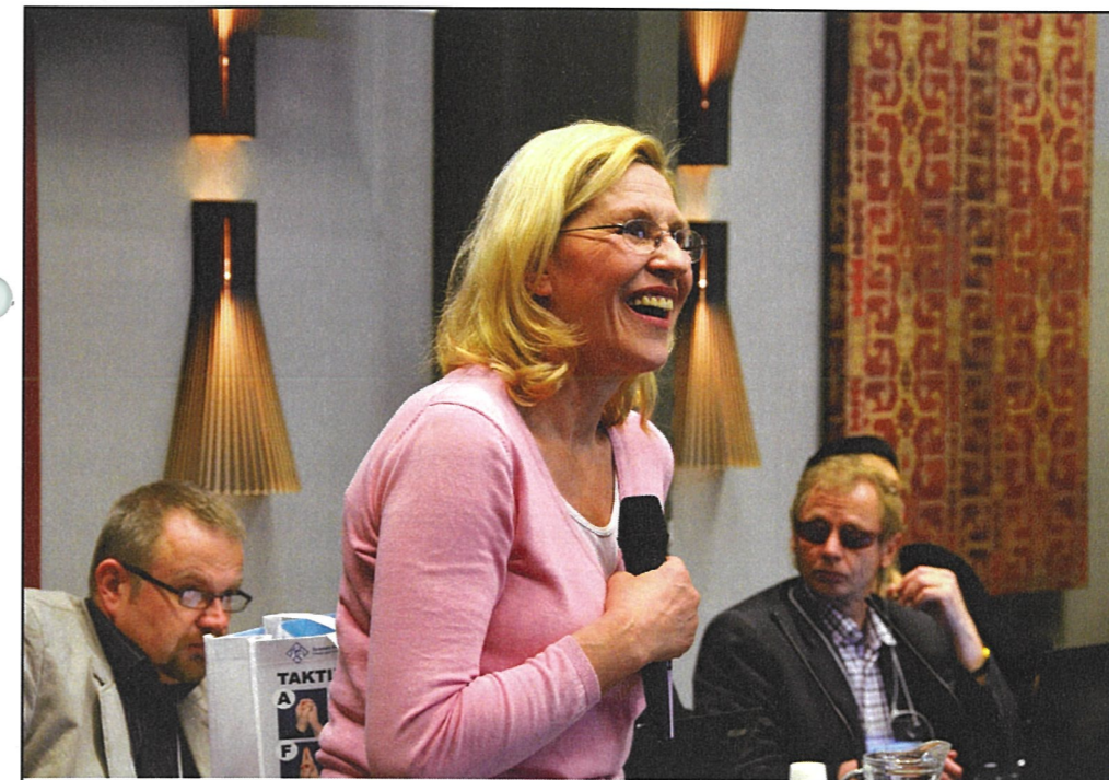
Skådespelerskan Eija Vilpas hälsade mötesdeltagarna med glada inledningsord.