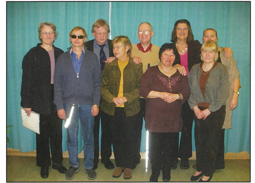
Arkistokuva. Edellisen kerran pohjoismaisten järjestöjen puheenjohtajat ja varapuheenjohtajat kokoontuivat Suomessa 23. - 26.10.2004. Kokous pidettiin Onnelassa, missä tämä ryhmäkuva on otettu. Seuraa DBNSK:n kokous on Suomessa ja Onnelassa 10. - 12.9.2010.