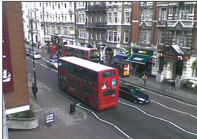
Katunäkymää Lontoosta. Kaksikerroksiset, punaiset bussit ovat paikallinen erikoisuus.

Kommunikaatio on huomattavasti laajempi käsite kuin meillä Suomessa usein annetaan ymmärtää. Kommunikaation tärkein osa on erilaiset kielet, sillä vain kielten avulla ihmiset voivat viestiä toisilleen mahdollisimman tarkasti. Tähän tuovat lisänsä vuorovaikutuksen muut muodot, kuten keholliset viestit, eleet, ilmeet ja äänet. Lontoon seminaariin oli kutsuttu kommunikaation eri osa-alueiden tutkijoita