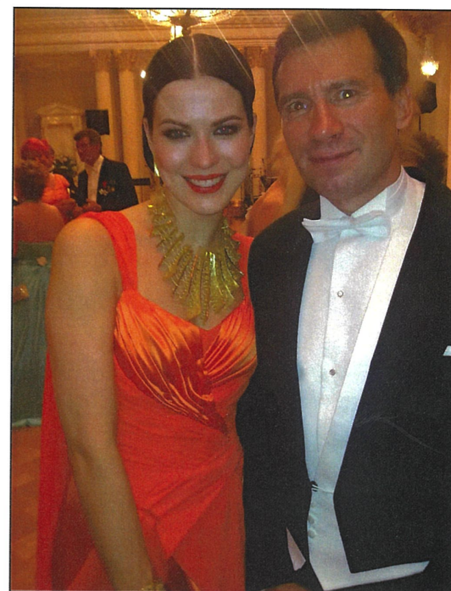
Vid presidentens festmottagning på självständighetsdagen 6.12. En av de personer jag talade med var sångaren och låtskrivaren Jenni Vartiainen.