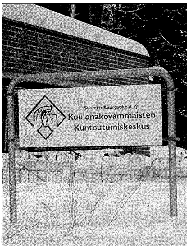
Resurscentret för synhörtsskadade