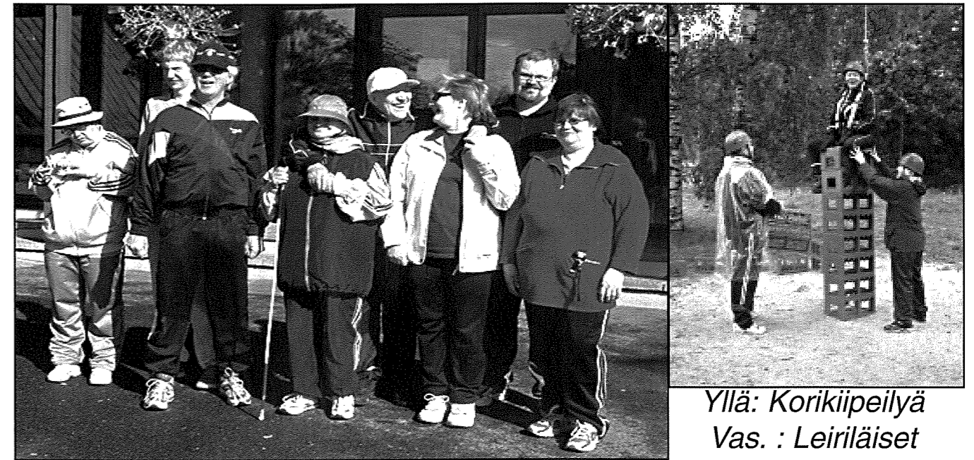
Yllä: Korikiipeilyä Vas. : Leiriläiset ryhmäkuvassa

Lauantaina satoi koko päivän vähän vettä. Meloimme jättikanooteilla. Lauloimme meloessamme vaikka mitä. Kanootteja oli kaksi. Yksi oh- jaaja kertoi soutamisesta. Aamulla