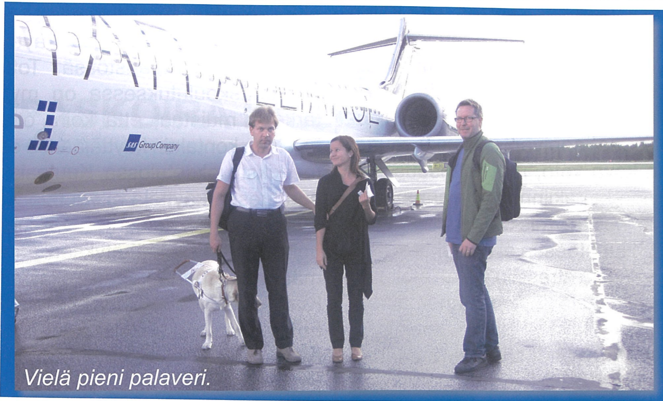
Vielä pieni palaveri.

teenä voidaan käyttää esimerkiksi reitillä olevia maastomuutoksia, liikennetolppia tai vaikkapa alustamuutoksia. Kuuloaistin puuttessa käyttäjä ei myöskään pysty kysymään neuvoa ulkopuolisilta, jos hän on yksin liikenteessä, tai ainakin keskustelu on hankalaa ilman tulkkia.