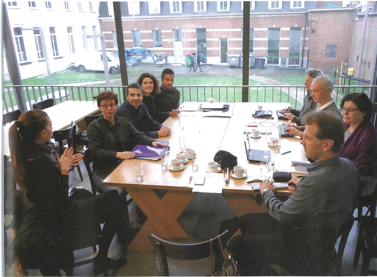
Museo M, Leuven, Belgia.

Maailmanliiton yleiskokous on keski- viikkona ja torstaina. Juhannusaattona perjantaina 22.6.2018 alkaa