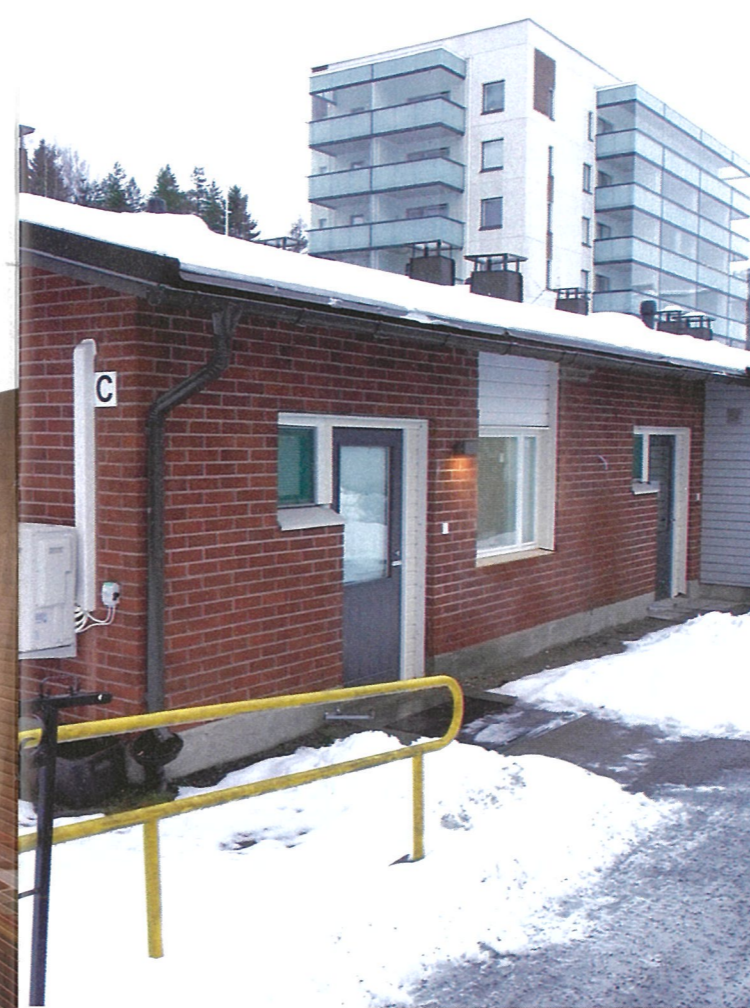
Kuurosokeiden Keskustoimisto on siirtynyt Tampereelle.

Keskittämisen syynä on järjestön toimintojen tehostaminen. Sosiaali-