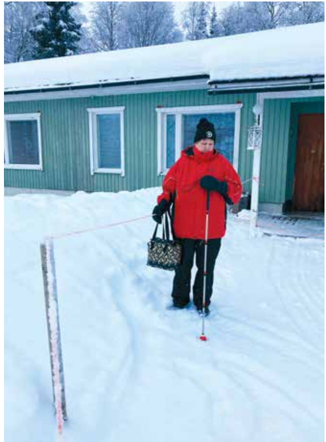
Ohjaava naru näyttää oikean kulkusuunnan.

– Meillä on omat viittomat altaassa toimiessa, jotka hän antaa. Vasemman käden etu -ja keskisormi tarkoittavat jalkoja. Kun hän puristaa minun etu- ja keskisormestani, tiedän, että jaloilla liikutaan ja että aletaan juosta. Oikea etusormi ja keskisormi tarkoittavat käsiä.