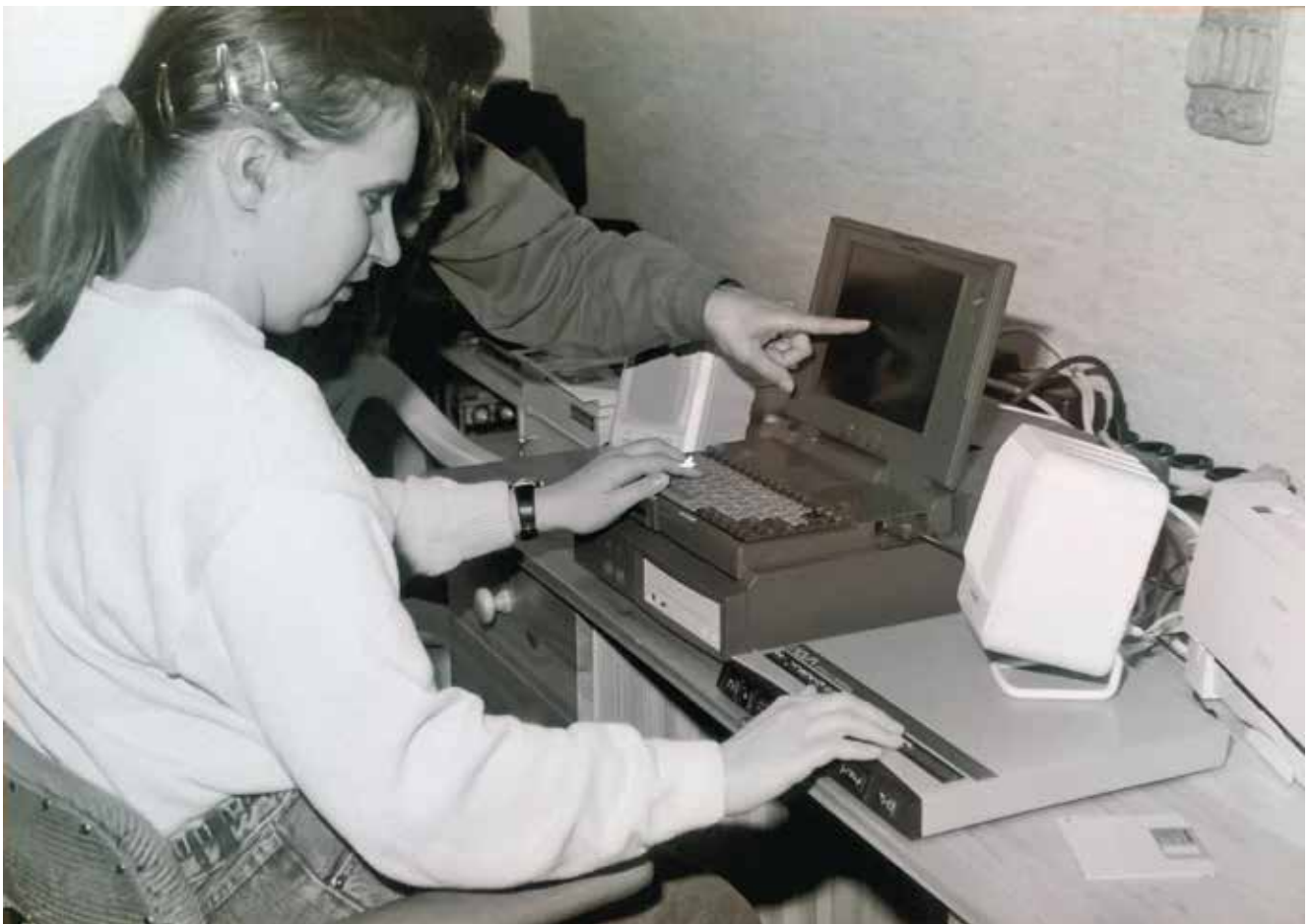
Tietokoneen käytön opettelua.

Tuntosarven toimitus kerää muistoja Suomen Kuurosokeat ry:n toiminnassa mukana olleilta. Valikoituja tekstejä julkaistaan juhluvuonna Tuntosarvessa. Tekstin voi lähettää toimitukselle osoitteeseen: viestinta@kuurosokeat.fi . Postiosoite: Viestintä, Suomen Kuurosokeat ry, Insinöörinkatu 10, 33720 Tampere. Liitä kirjekuoreen mukaan myös yhteystietosi. ■