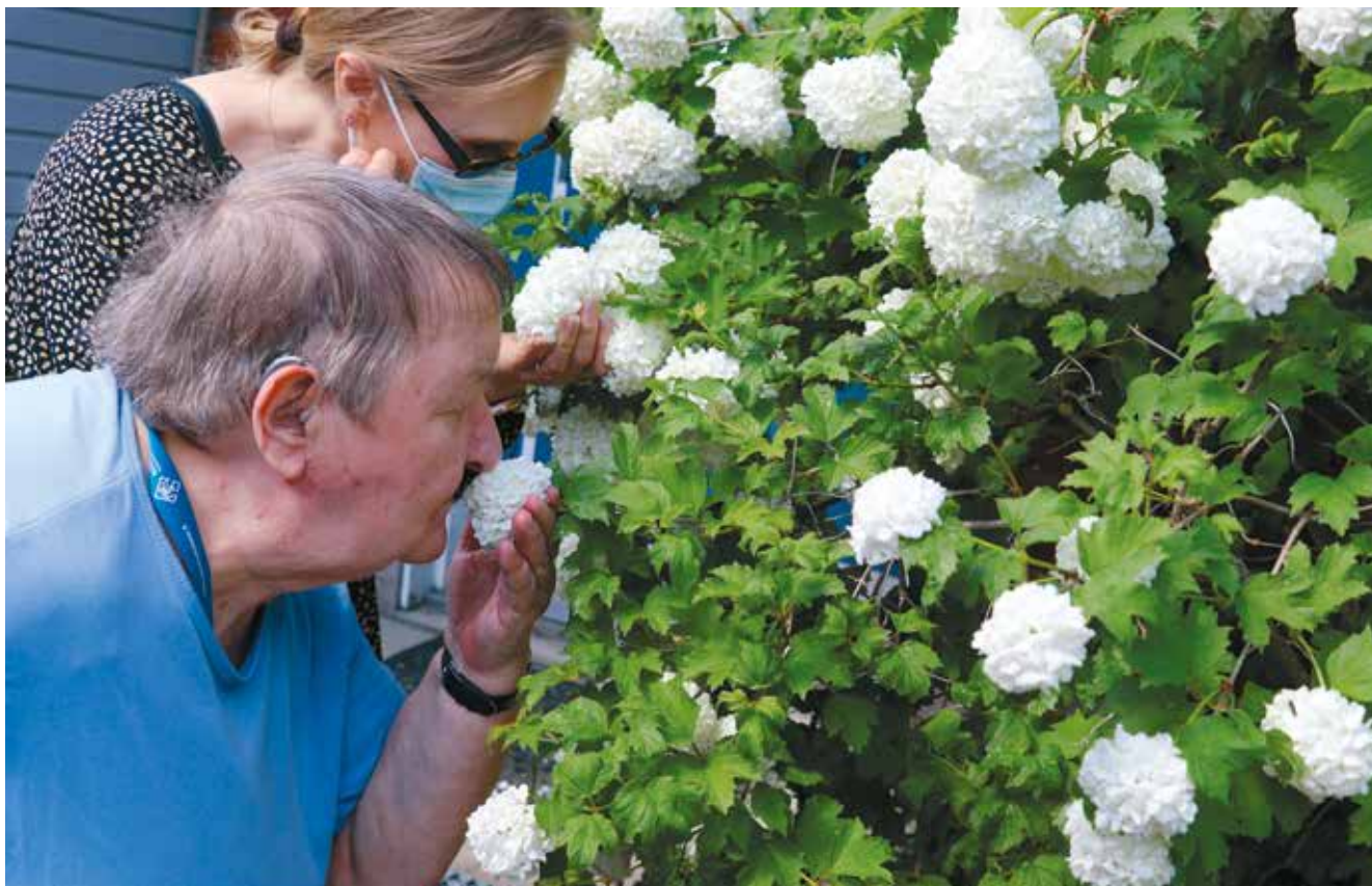
Kaikilla aisteilla -kurssi aistipuutarhassa Kuurosokeiden Toimintakeskuksella.