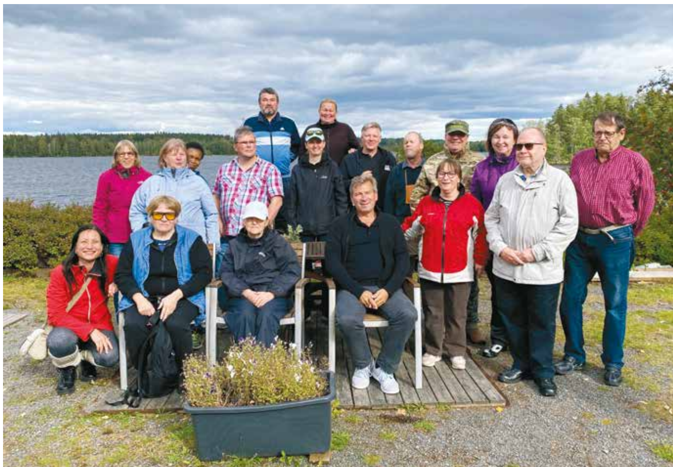
Viittojat-kerho vierailulla Eräjärvellä.

Sisältö: Koulutuksen jälkeen kuurosokeat kokemusasiantuntijat osaavat kertoa kuurosokeudesta, Suomen Kuurosokeat ry:stä ja oman henkilökohtaisen tarinansa.