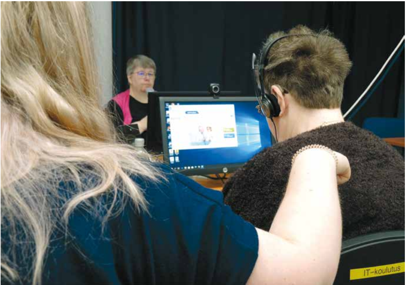
ICT-koulutusta Kuurosokeiden Toimintakeskuksella.