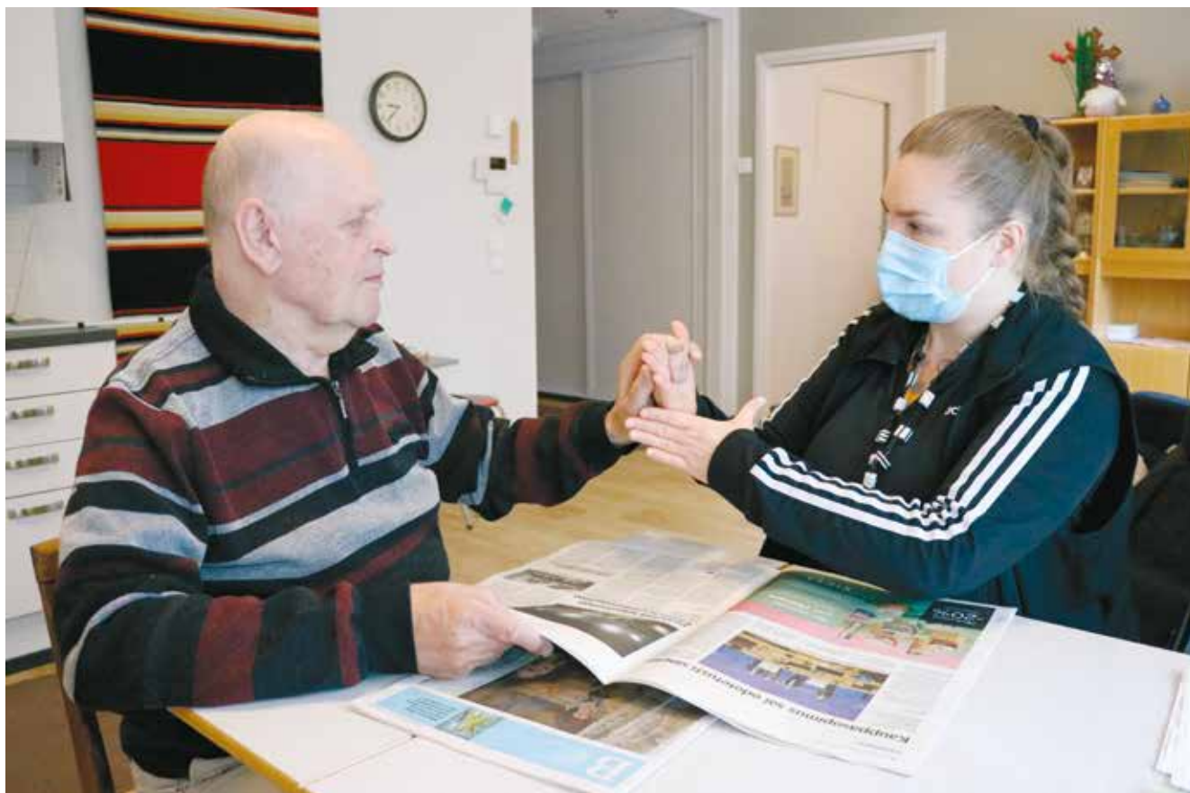
Lehden lukua.