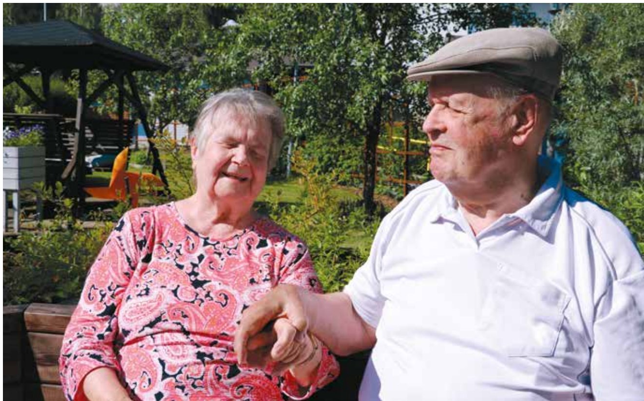
Taktiilikommunikointia kädestä käteen.