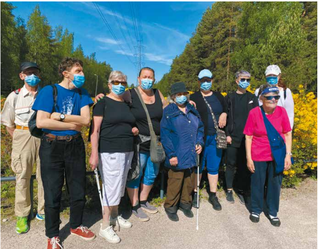
Yhdessä ulkoilua.

Toimintakalenterin tietoihin voi tulla muutoksia. Niistä kerrotaan yhdistyksen viestintäkanavissa. Tutustu ja ilmoittaudu mukaan tapahtumiin sekä koulutuksiin!