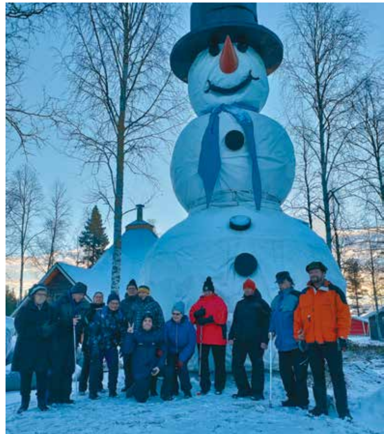
Lomakeskuksen pihalla otettiin yhteiskuva jättiläislumiukon edessä.

Aamupäivän ohjelmaan kuului vierailu Tatukan porotilalla, jossa käytiin syötämässä poroille jäkälää. Porotilan