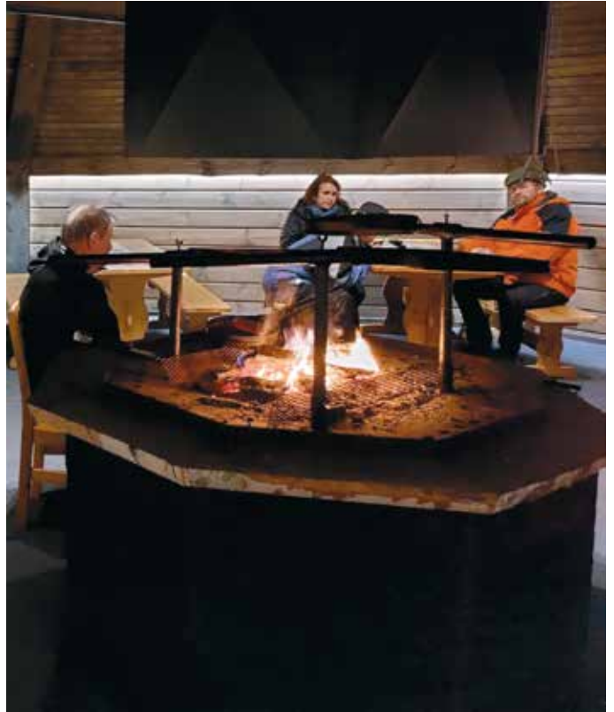
Kodassa pääsi nuotion äärelle.

Lopuksi pidettiin palautekeskustelu. Kaikki pitivät Palojärven paikasta, kun siellä oli loistava valaistus sisätiloissa, varsinkin ruokalassa, sekä esteettömän ympäristö ja hyvää ruokaa. Ohjelmasta, järjestelystä ja bussikuljetuksesta saatiin erittäin hyvää palautetta. Kaikki olivat tyytyväisiä tapahtumaan. Sitten kerroin omasta pyöräretkestäni Suomen halki Haminasta Kilpisjärvelle. Nautittiin myös lounas ennen kotimatkaa Rovaniemen kautta Ouluun. ■