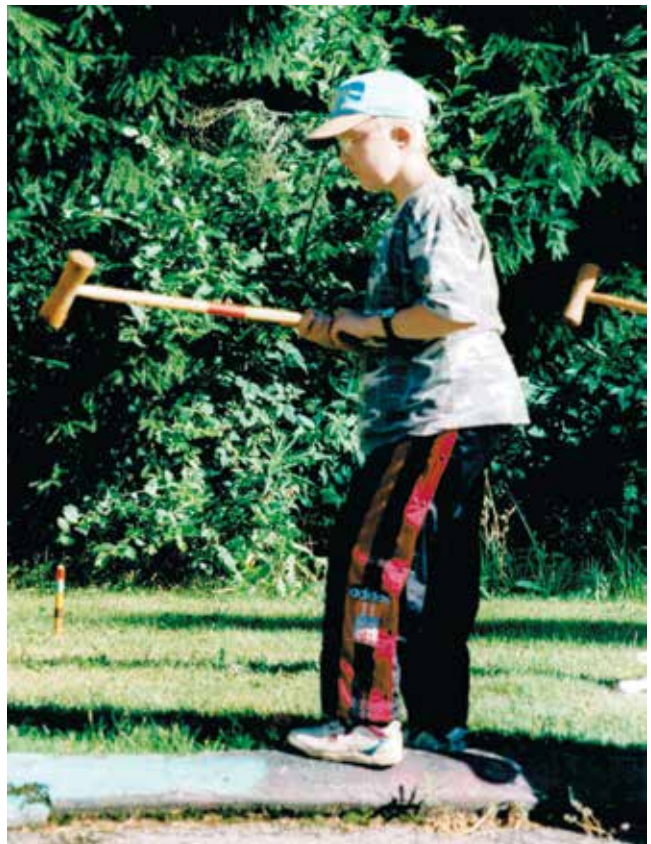
Krikettiä pelaamassa kesäleirillä 2000.