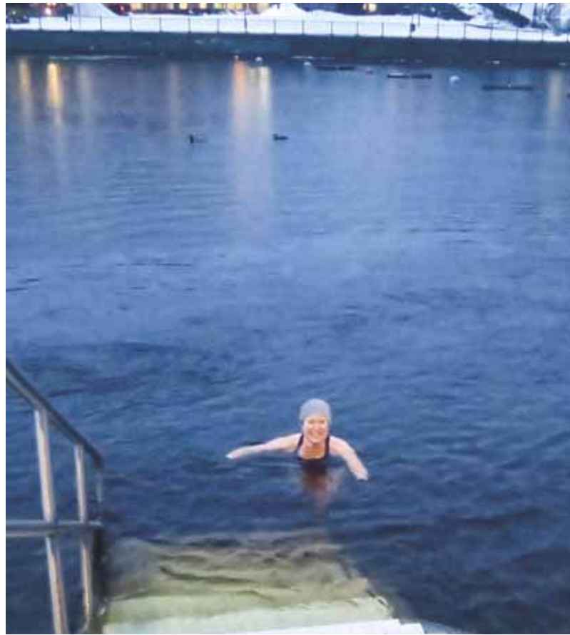
Lilla uimassa iltahämärässä.

-Saan valtavan paljon hyvää oloa niin fyysisesti kuin psyykkisesti! Lisäksi olen saanut uusia tuttavuuksia ja kohtaamisia.