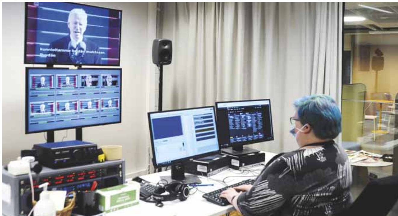
Suorat tv-ohjelmat tekstitetään käsin.

toimittajaa ei voi vain lainata naapuri-toimituksesta.