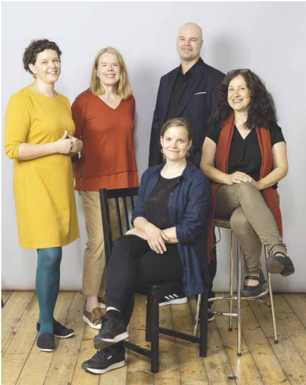
Selkolehtien toimitus.

- Japanilainen, maailman kahdeksanneksi suurin sanomalehti teki siitä näyttävän jutun. Heitä kiinnosti se, että selkokieli koetaan Suomessa niin tärkeäksi, että jopa pääministeri ja puolustusministeri osallistuivat tuohon tenttiin.