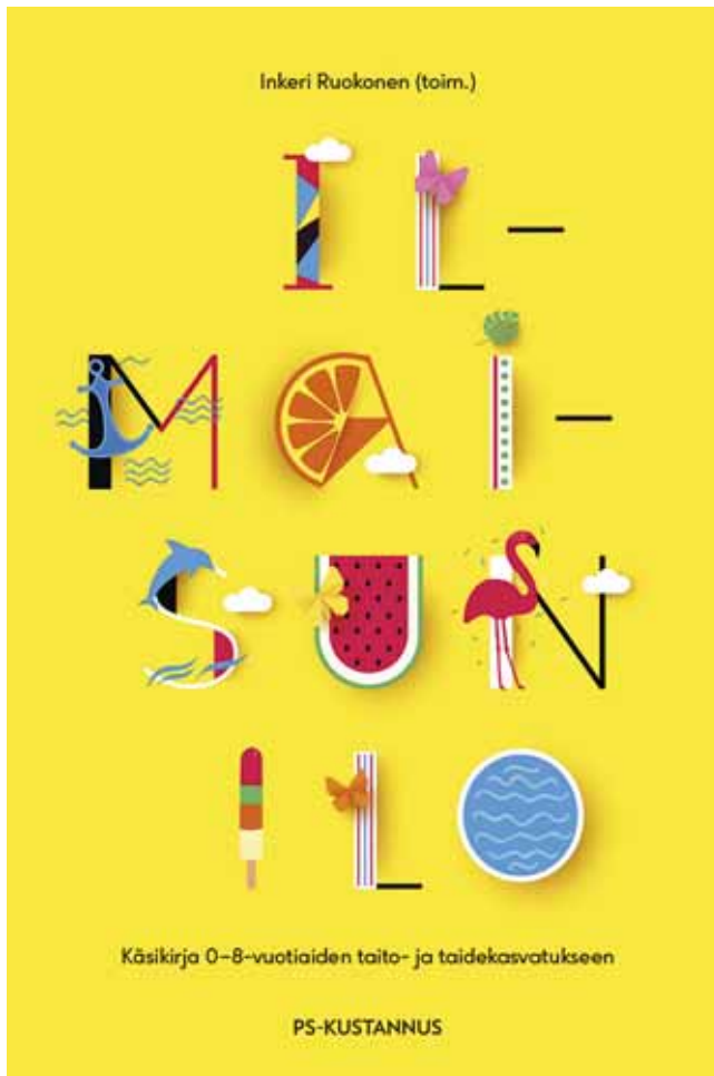
Ilmaisun ilo -kirjan kansi.

ja mahdollisuus monipuoliseen taiteelliseen toimintaan, kokemiseen ja tekemiseen. Käsikirjan tavoitteena on välittää tietoa siitä, miksi taito- ja taidekasvatus on niin olennaista lapsen kehitykselle, oppimiselle ja hyvinvoinnille juuri varhaisvuosina ja alakouluiässä. Artikkelit vahvistavat kokonaisvaltaista varhaiskasvatuksen sekä esi- ja alkuopetuksen taito- ja taidepedagogiikkaa, joka liittyy vahvasti lapsen ilmaisuun ja leikkiin, Ruokonen toteaa.