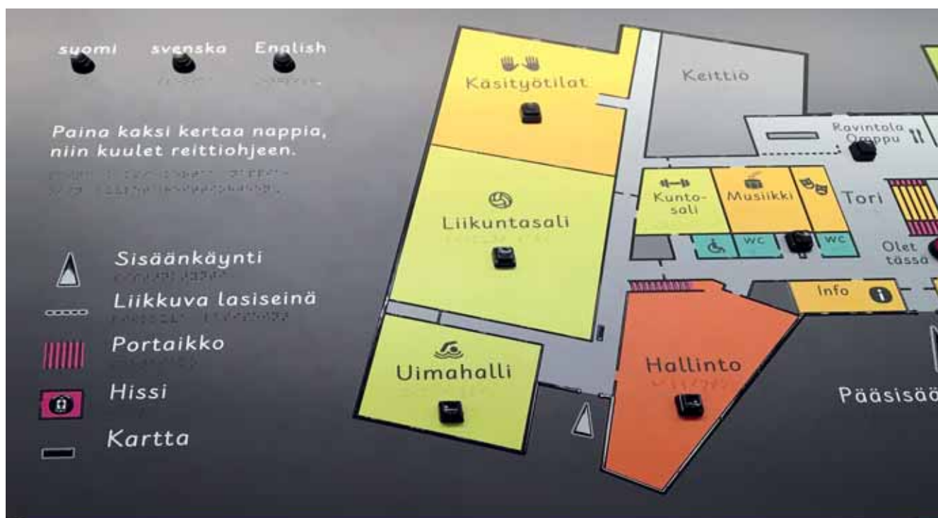
Kuva 2. Valteri-koulu Onervan kohokartta.