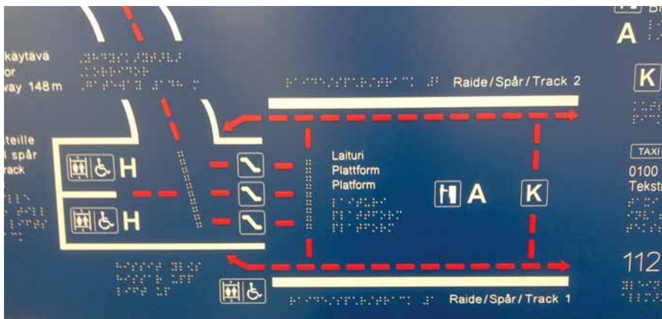
Kuva 1. Helsinki-Vantaan lentokentän kohokartta.

Jos kiinnostuit tilan ja reittien kuvailusta sekä selkään kuvailusta, ota meihin yhteyttä: kommunikaatiopalvelut@kuurosokeat.fi ■