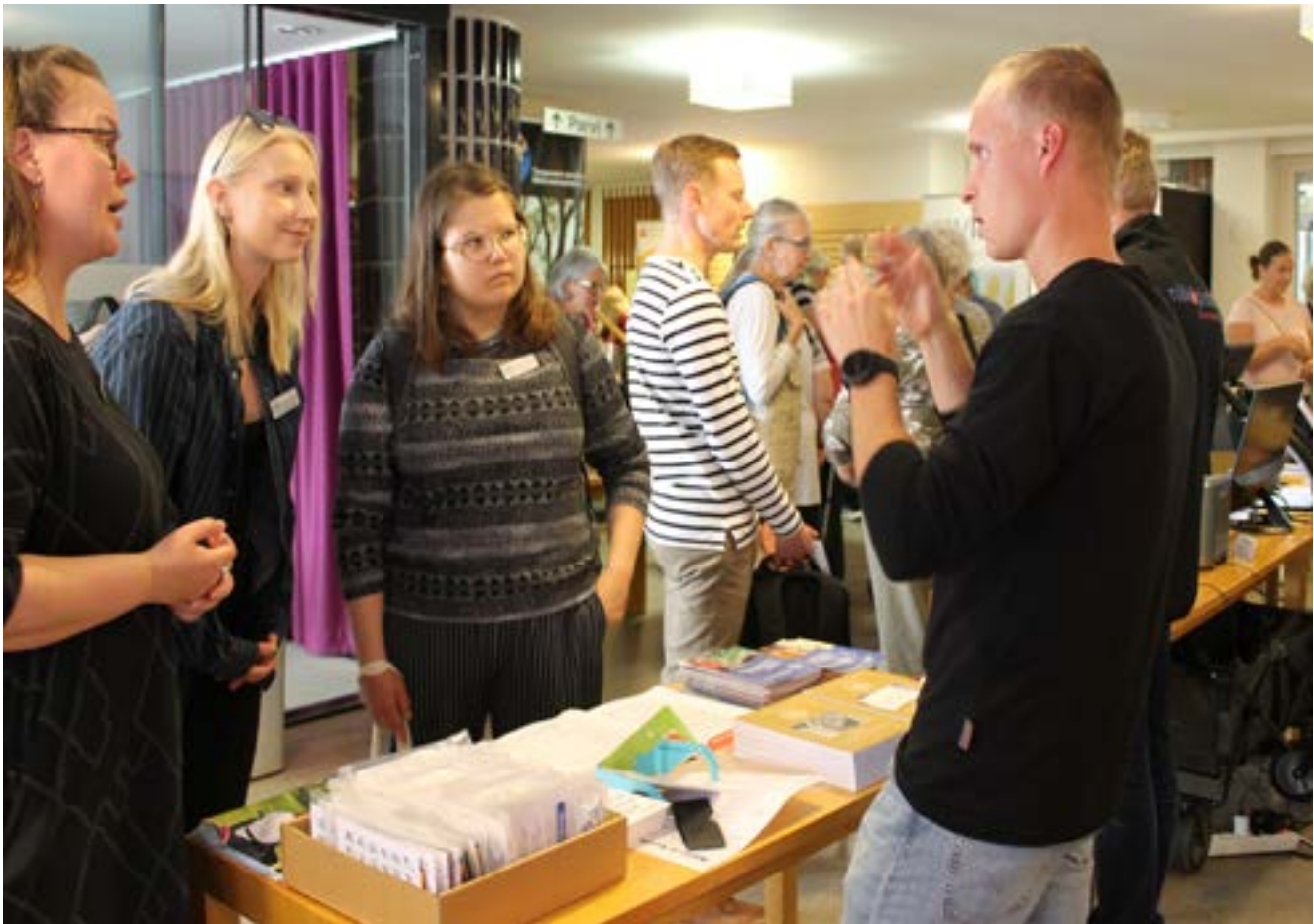
Kuva: Aluepalvelut ovat siellä missä asiakkaatkin.