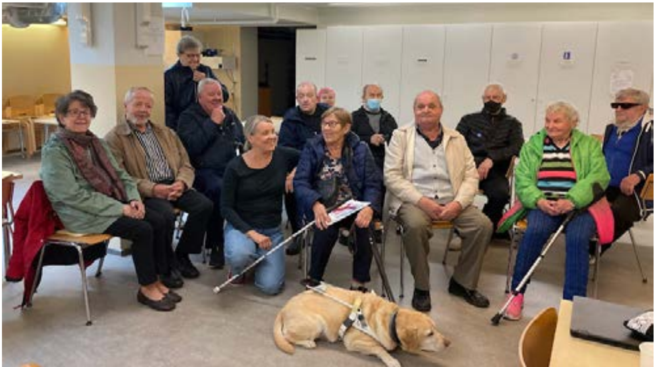
Kuva: Osallistujia Keski-Pohjanmaan aluetapahtumassa.

Toimintakalenterin tietoihin voi tulla muutoksia tai peruutuksia. Niistä kerrotaan yhdistyksen viestintäkanavissa. Tutustu ja ilmoittaudu mukaan tapahtumiin sekä koulutuksiin!