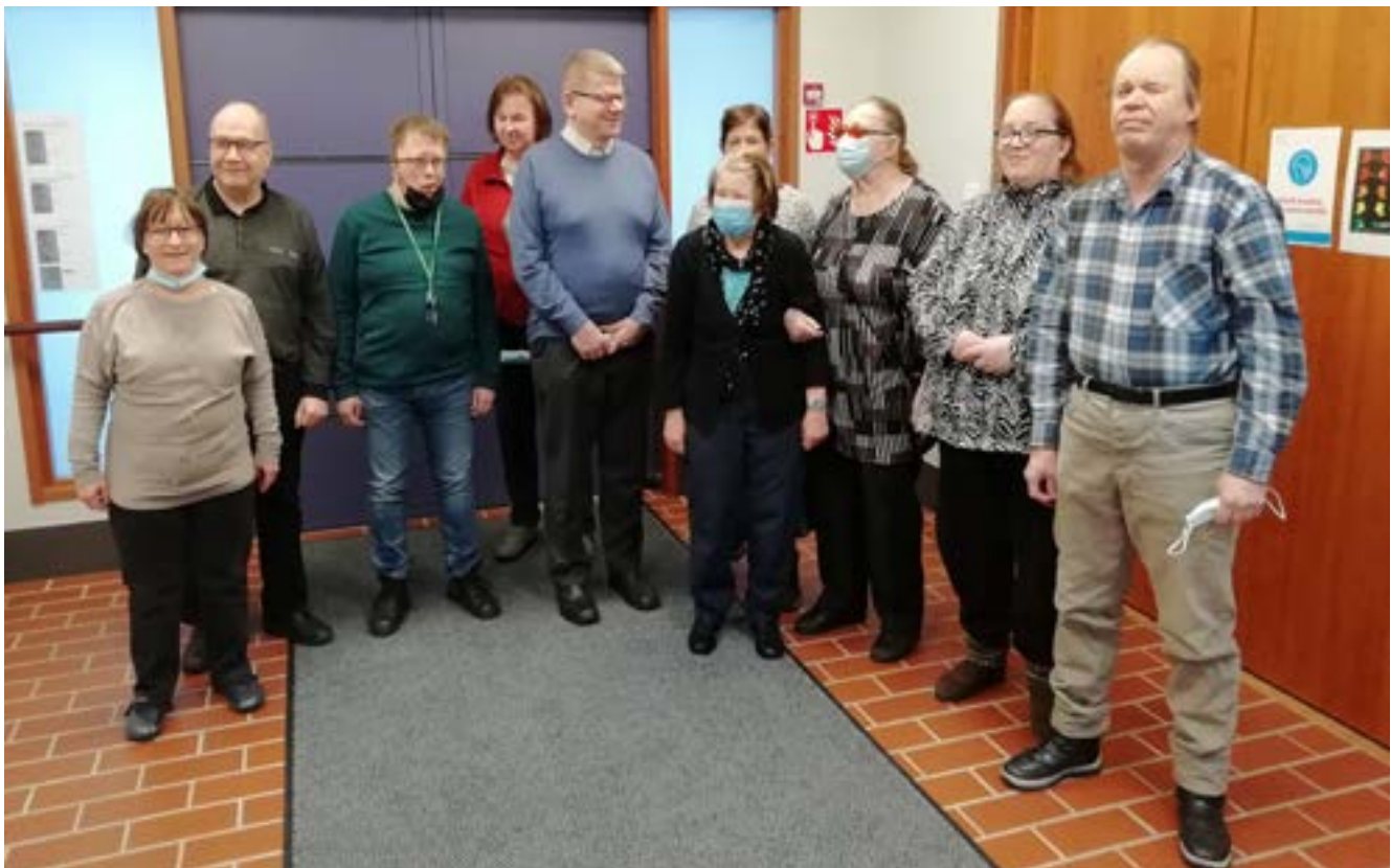
Kuva: Kerhonvetäjiä Kuurosokeiden Toimintakeskuksella.

Kerhot kokoontuvat myös muualla vapaaehtoisen vetäjän löytyessä.