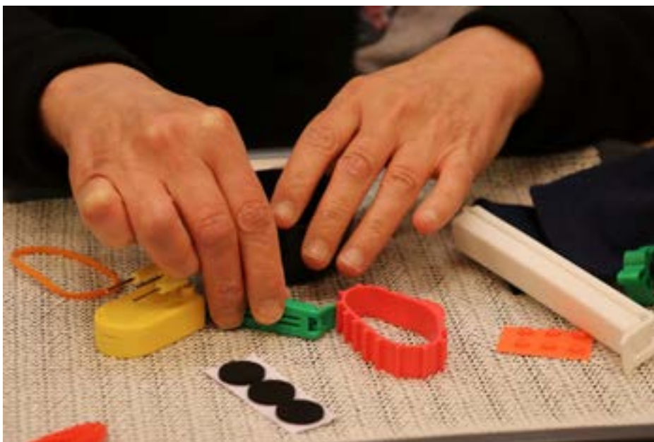
Kuva: Kuntoutuksessa voidaan harjoittaa aistien käyttöä monipuolisesti.

Yhteystiedot: kuntoutuksen palveluesimies Hanna Tenhunen, hanna.tenhunen@kuurosokeat.fi , puh. 0400 965 671.