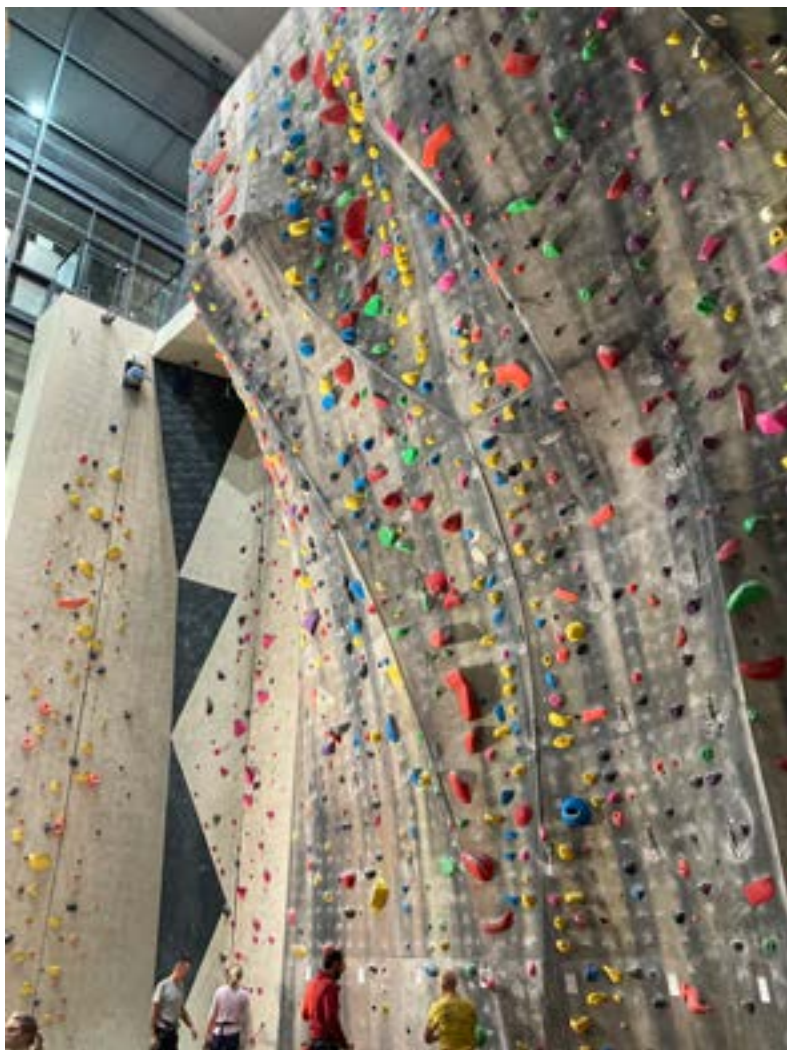
Kiipeilyseinä ja sen värilliset otteet. Ihmisiä seinän edessä alhaalla.

Tämän jälkeen aloin varsinaisesti kiipeillä. Alhaalla oli vähän hankala löytää jaloille sopivia sijoituspaikkoja, koska siellä ovat myös metalliset valjasvaijereiden varmistusputket, mutta kyllä niillekin sai astua. Seisoessani ensimmäisillä otteilla, katsoin ylöspäin mistä voisin ottaa käsilläni kiinni