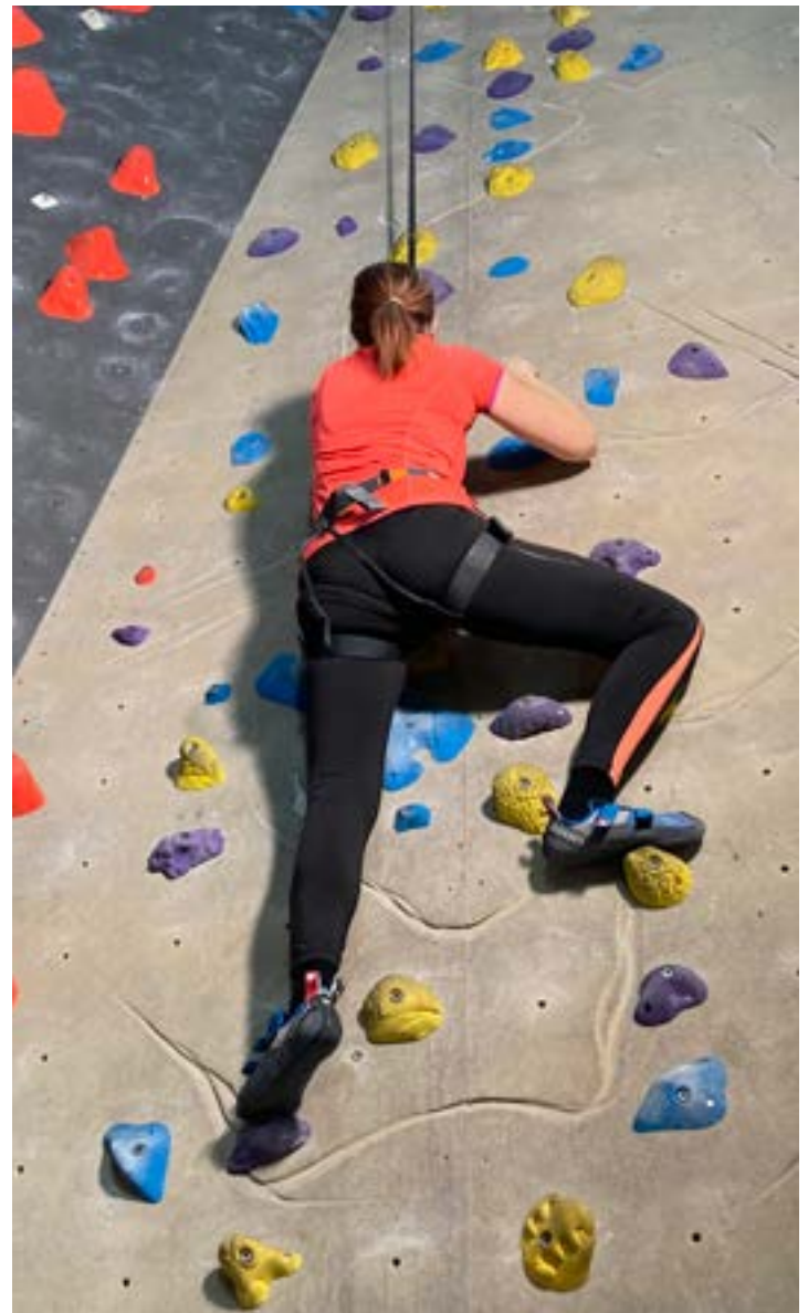
Taru kiipeää seinällä.

Seisoessani korkean seinän edessä matalan patjan päällä, siskoni avomies kiinnitti vaijerin valjaissani olevaan lenkkiin ja ohjeisti kiipeilyyn sekä miten laskeudutaan alas. Otin käsilläni kiinni parista otteesta lattialla seisoen, sitten etsin katseellani ensimmäisen jalansijan ja tämän jälkeen ponnistin itseni ylös toiselle jalansijalle. Valjaat varmistivat, etten pääse putoamaan. Kiipesin ensin vain vähän, sitten kokeilin pudottautumista. Se oli liian matalalta, pudottautuminen onnistuu paremmin korkeammalta.