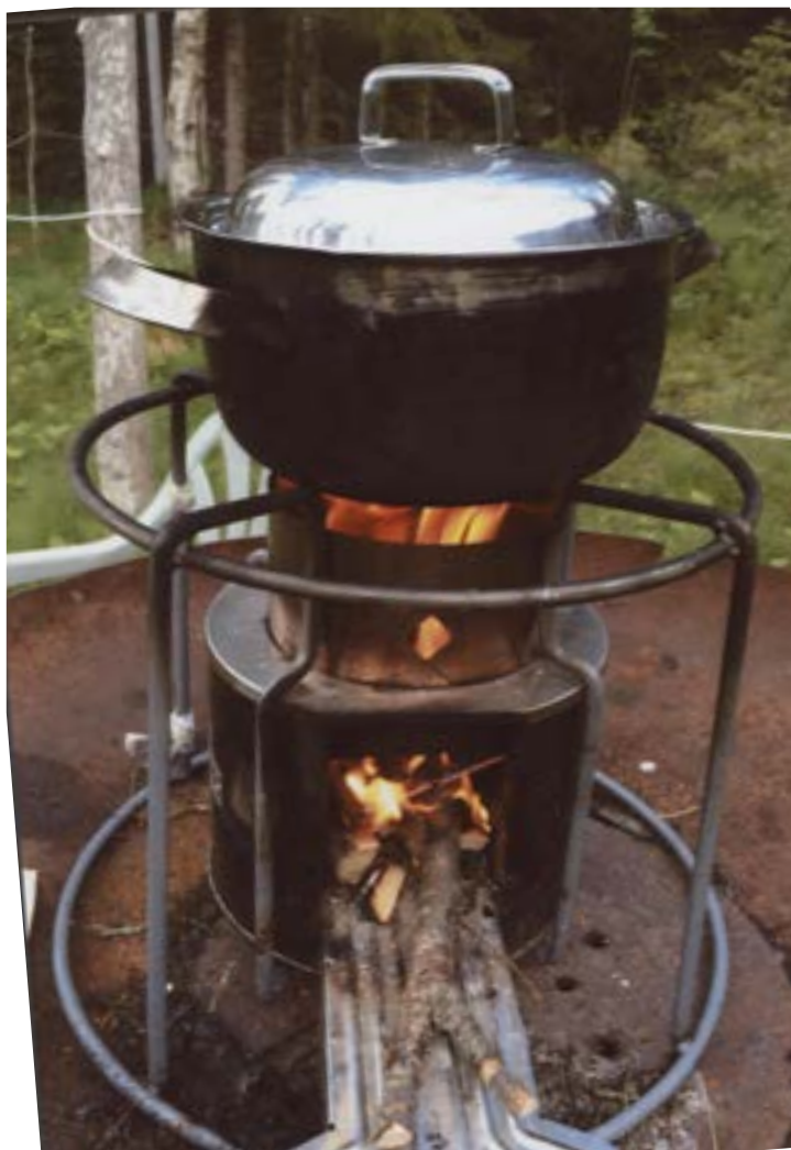
Risukeitin eli kesäkeittiö. Alaosassa on nuotio ja puita. Yläosassa on iso kattila, jonka seinät ovat mustat ja kansi päällä. Ympärillä on pyöreä metallikehikko.

- Mökillä on kamiina, jota lämmitän polttopuilla. Käyn mökillä vain kesällä noin viisi viikkoa, joten tämä lämmitystapa riittää. Ruoan laitan ulkona risukeittimellä, jonka ympärillä on metallinen kehikko suojana. Veden saan kaivosta, josta saan hyvää ja kylmää vettä. Kaivon ylivuotoputki on johdettu muovilaatikkoon, jossa ruoka pysyy kylmänä. Se on minun jääkaappini. Maito kestää siinä helposti viikon hyvänä.