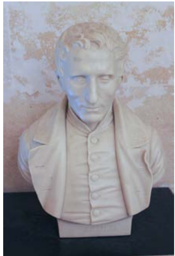
Louis Brailleen marmoripatsas Panthéonissa, Pariisissa. Patsasta sai koskea.