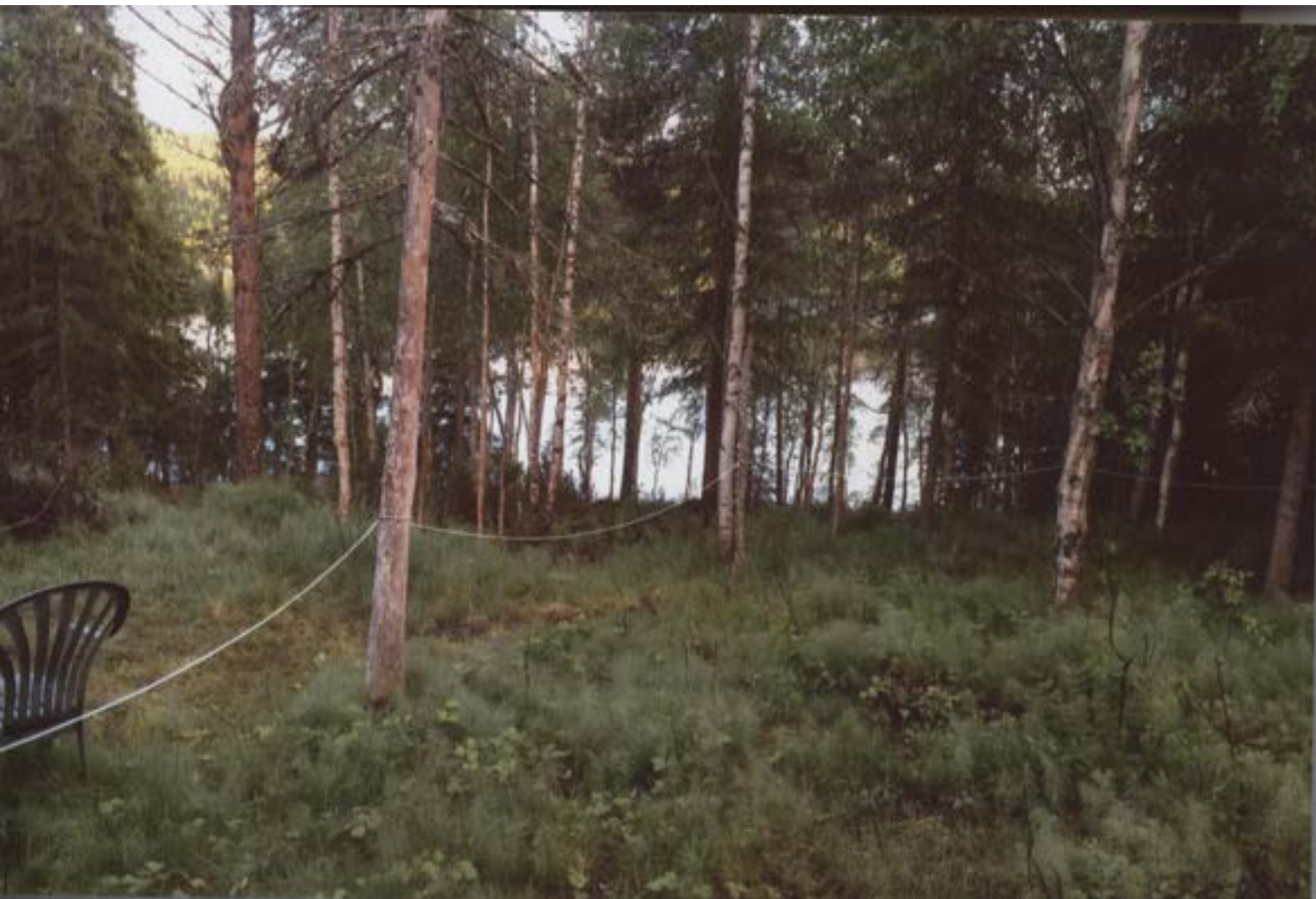
Narut pihapiirissä auttavat liikkumisessa.

- Mökin lähellä on Auttiköngäs, jonne on noin seitsemän kilometriä matkaa. Ennen kävelin sinne, mutta nykyisin se on hieman liian hankala matka opaskoiralleni Kreetalle. Niin kauan käyn mökillä, kun vain jaksan. ■