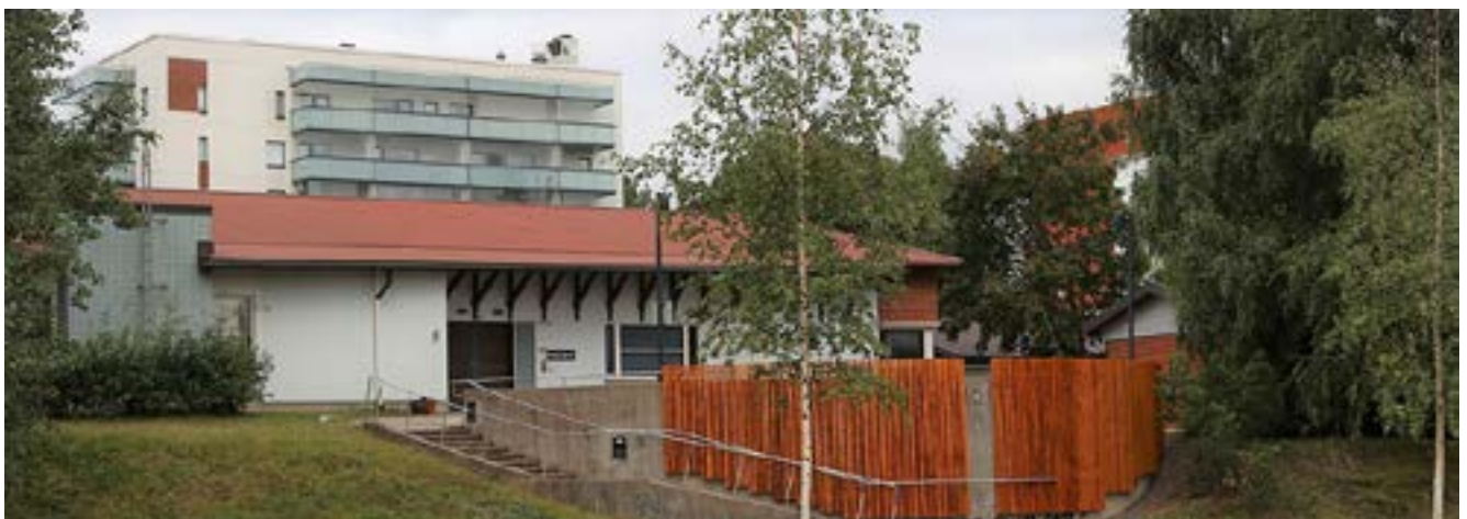
Kuurosokeiden Toimintakeskus on valmiina vastaanottamaan vieraat!