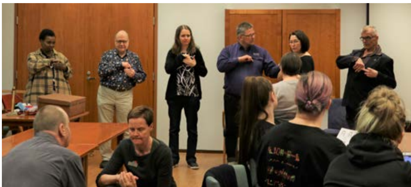
Kuoro esittämässä virttä 919.