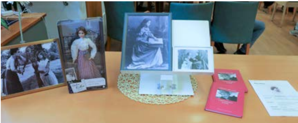
Kansainvälisen kuurosokeiden päivän tunnelmaa viime vuodelta.