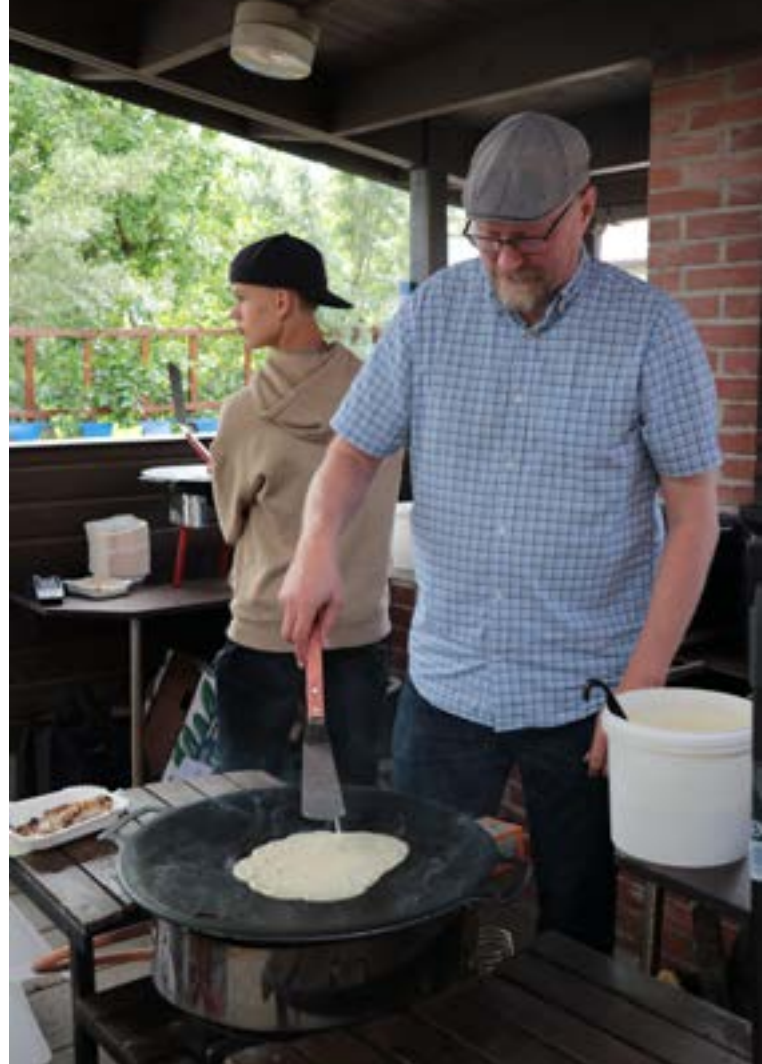
Lions Club Harju oli paistamassa lettuja ja makkaraa aistipuutarhassa.