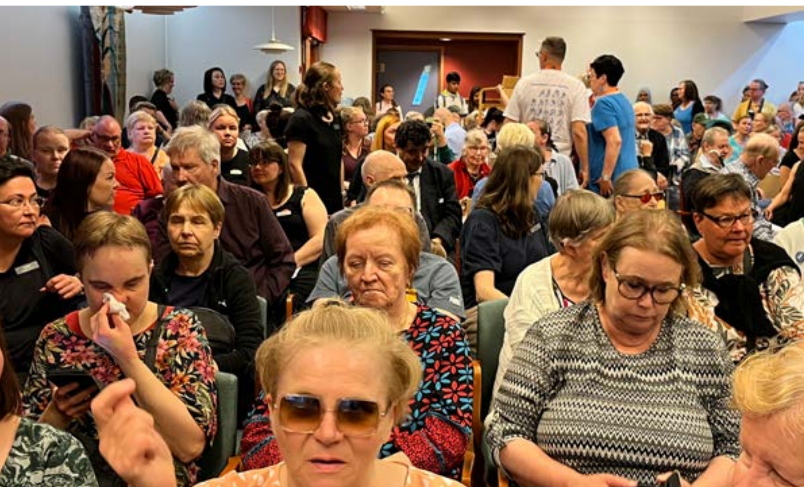
Yleisöä oli sali täynnä.