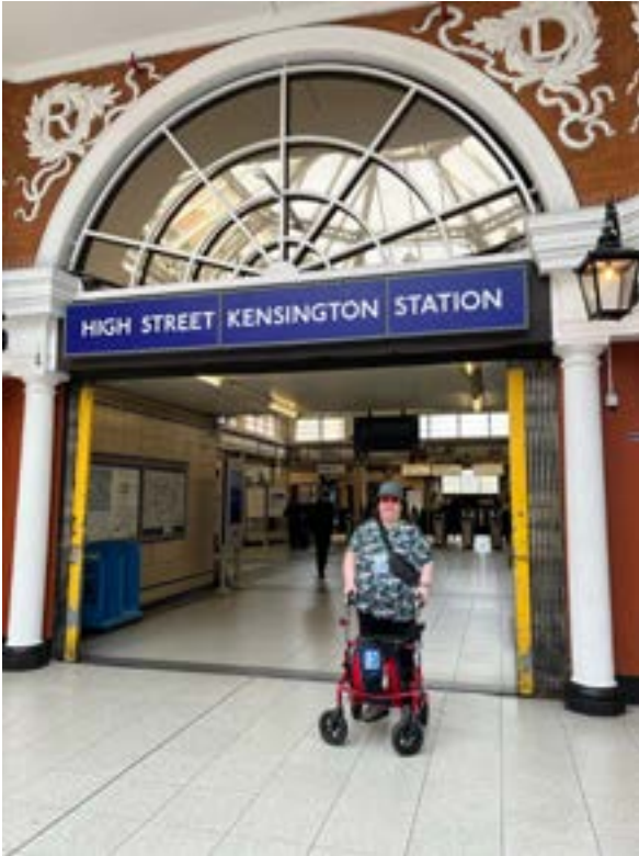
Metroasema High Street Kensingtonissa.

London Eye. Laivalla söimme perinteisen Fish 'n Chips -annoksen.