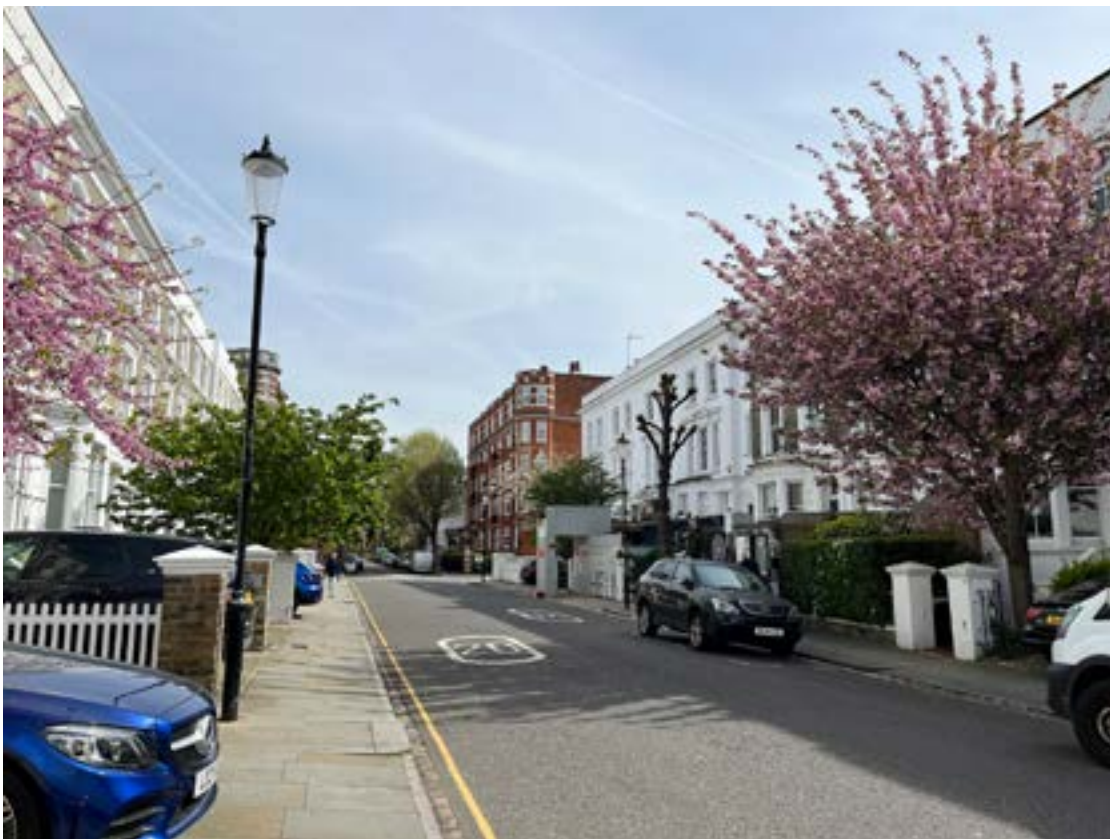
Hotelli sijaitsi Kensingtonissa kadun varrella, jossa kukki kirsikkapuita.

Perjantaina hyvän englantilaisen aamiaisen jälkeen lähdimme metrolla Westminster Stationille. Siellä ihasteelimme Big Beniä ja parlamenttitaloa. Sitten jatkoimme laivalaiturille päästäksemme jokiristeilylle. Näimme Tower Bridgen, modernin keskustan pilvenpiirtäjäineen sekä maailmanpyörä