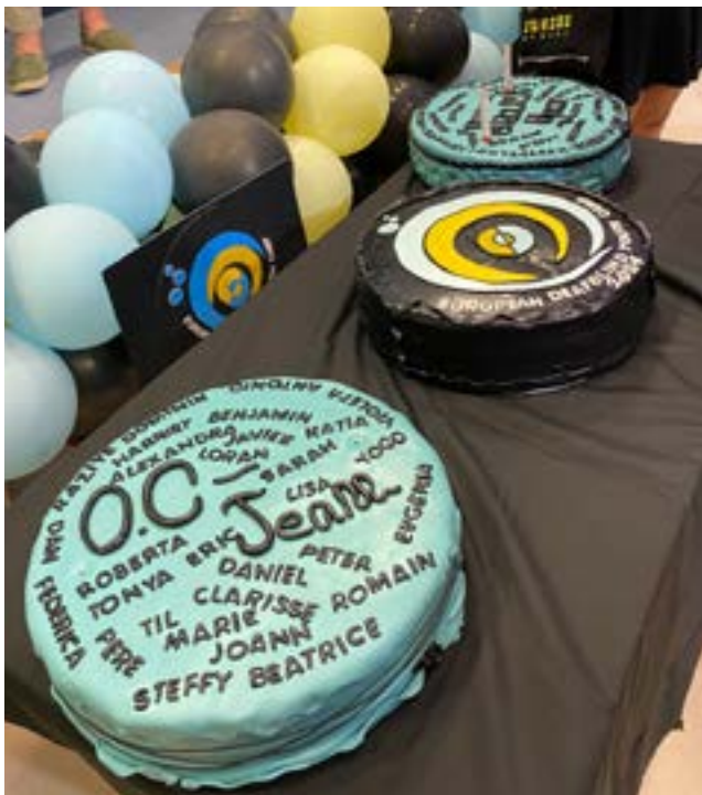
Tarjolla kolme kakkua, joissa yhdessä oli Euroopan kuurosokeiden nuorten logo ja muissa osallistujien nimet.