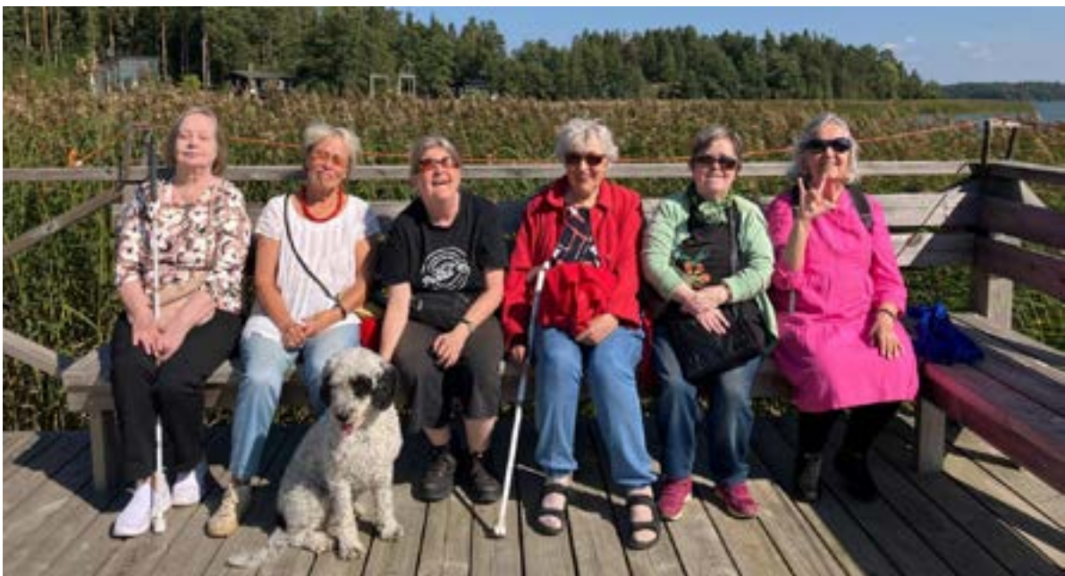
Turun kerholaisia Merimajan laiturilla.

Kaikki toivoivat uutta vierailua Merimajalle. ■