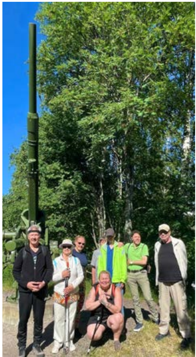
Lauttasaaren ulkoilupuistossa ilmatorjunnan muistomerkillä.

vaihteli: välillä oli haastavia polkuja, välillä hyväkuntoista lenkkeilytietä. Lopuksi vain ohjaaja uskaltautui uimaan. Vesi oli lämmintä ja pohja hiekkaisen pehmeä.