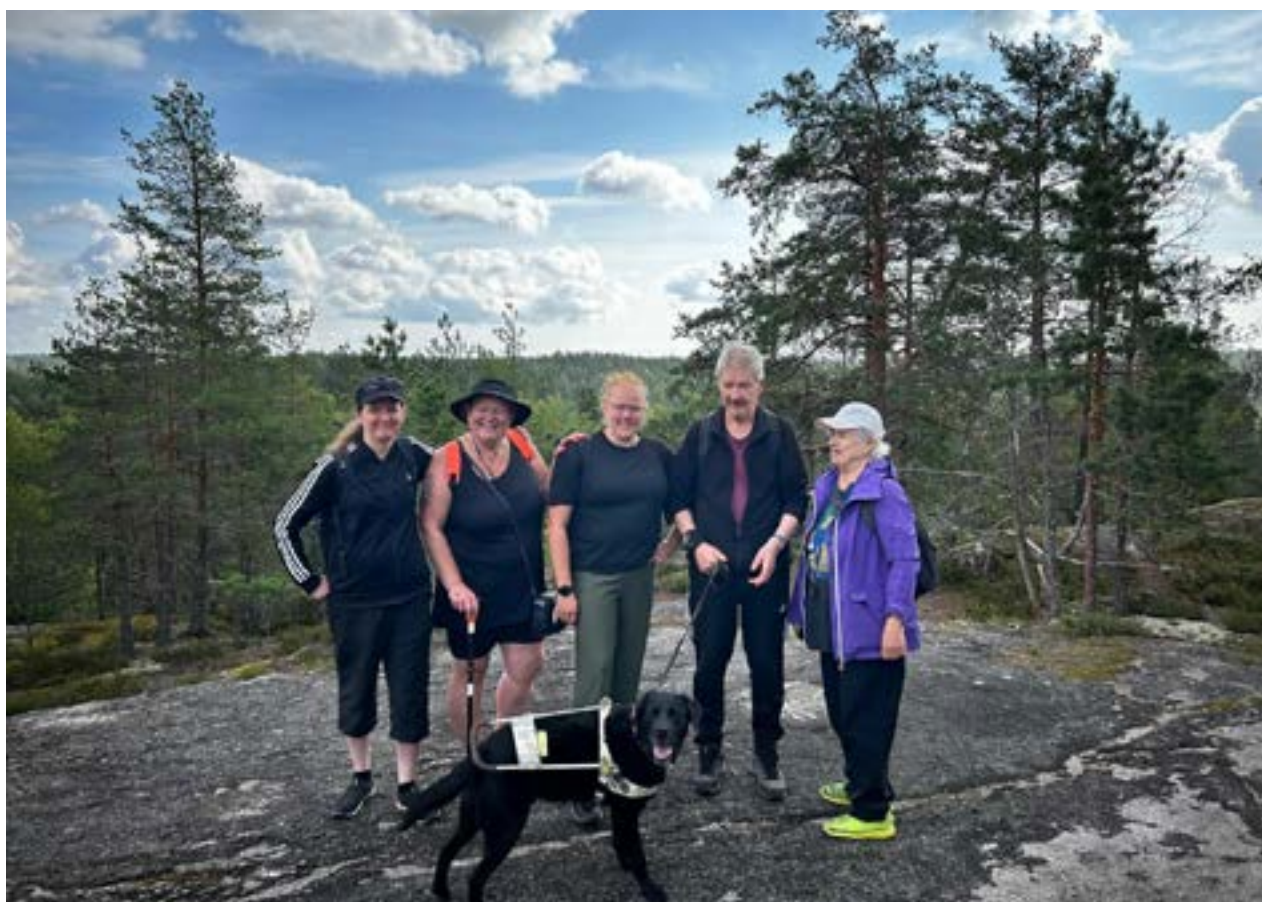
Osallistujia Kaitalammen näköalapaikalla

Kesällä 2025 on suunnitteilla järjestää lisää ulkoilupäiviä, joista tiedotamme myöhemmin. Kaikki ovat tervetulleita mukaan! ■