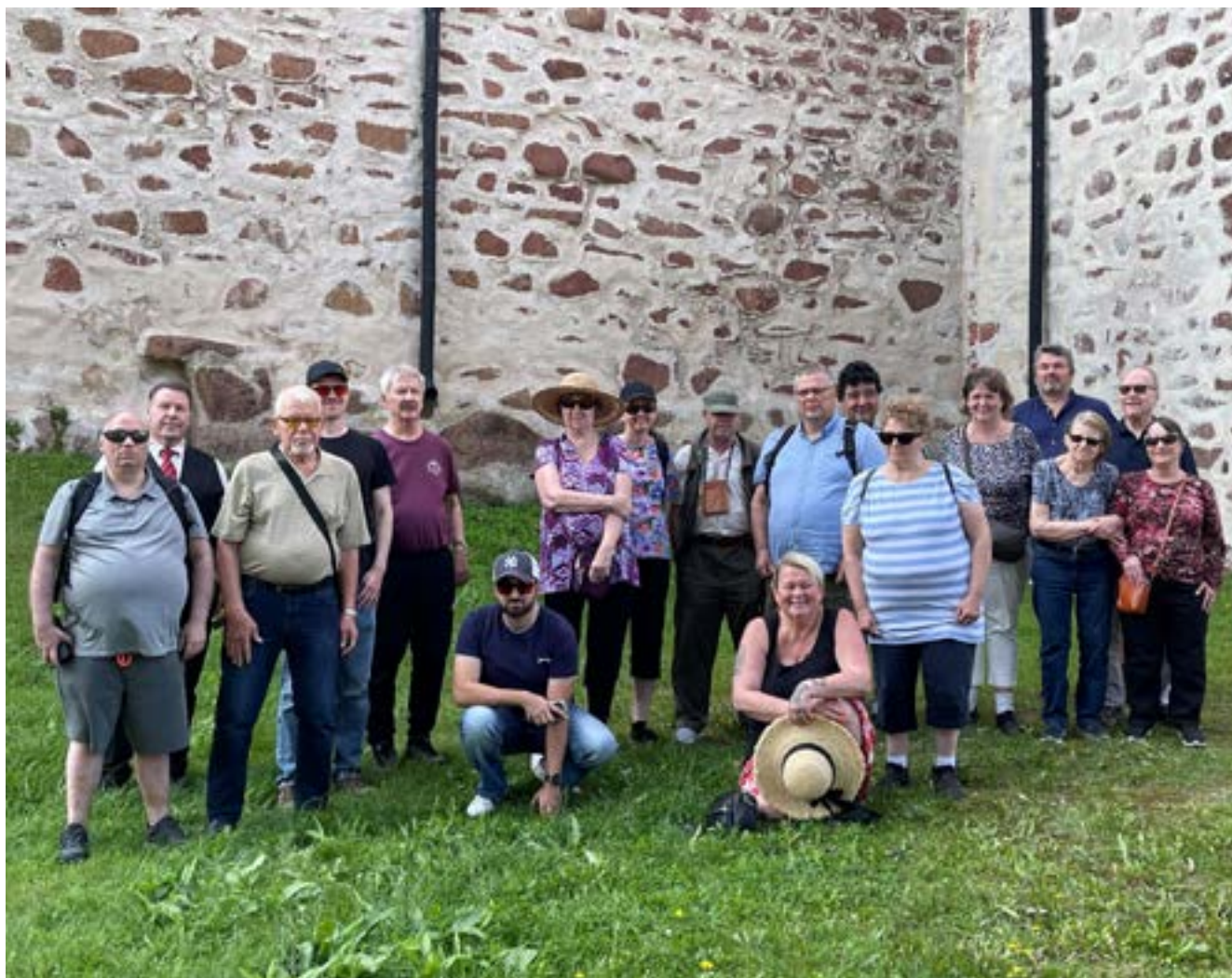
Retken osallistujat Kastelhoman linnalla.

Kuvia retkeltä on lisää kerhon sivuilla: https://kuurosokeat.fi/kerhot/viitot-jat/ ■