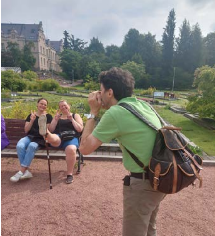
Kaisaniemen kasvitieteellinen puutarha