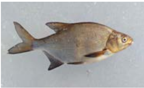
Suurin kala oli kilon painoinen lahna.