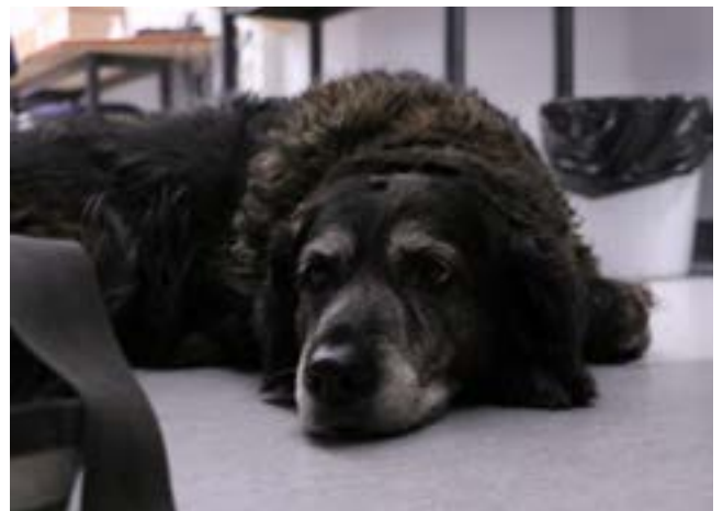
Opaskoira Kreetta tauolla.

-Se vaatii sekä koiralta että käyttäjiltä paljon tekemistä. Varsinkin nuoret ehkä käyttävät muita palveluja, joka on hiukan harmillista koska opaskoira voisi avata toisenlaisen maailman myös nuorille. ■