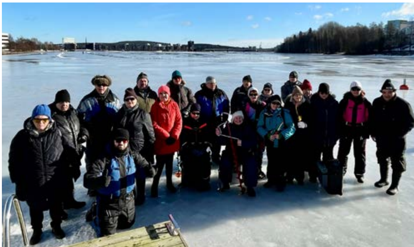
Kalakerhon ryhmäkuva Jyväsjärven rannalla.