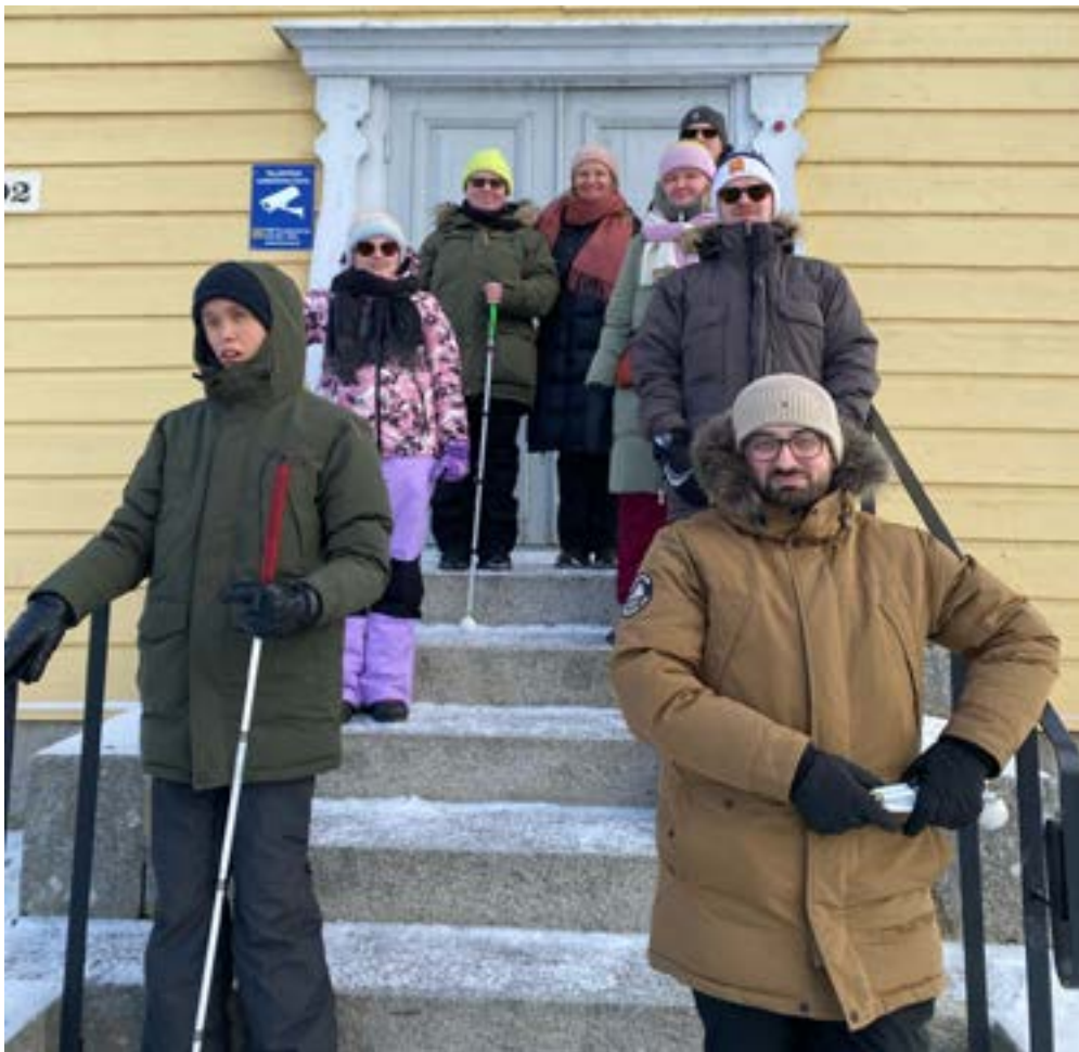
Nuoret Eräjärven kirkon portailla

Tämä oli ensimmäinen kerta meille, kun järjestimme itse viikonlopun Erätuvalla. Kokemus oli erittäin hyvä. Eräjärven Erätuvan ympäristö on