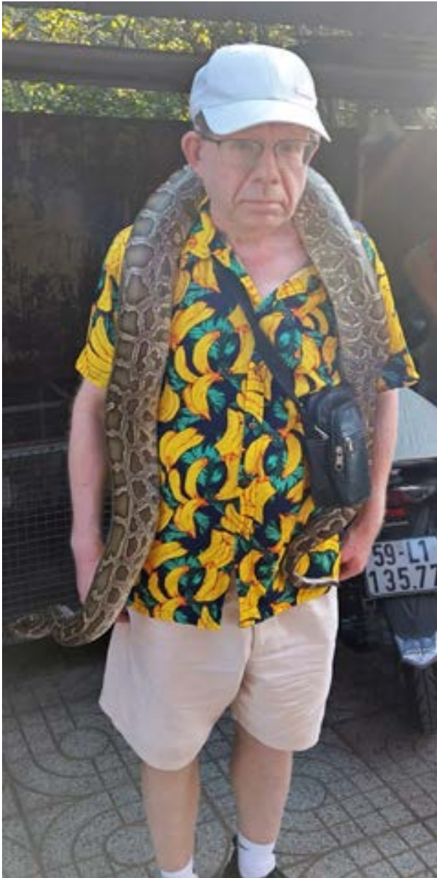
Jounin kaulalla verkkopython, yksi vaarallisimmista kuristajakäärmeistä

Teksti: Jouni Naroma