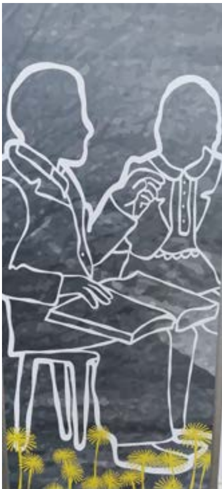
Ääriiviivapiirustus. Pohjana Frans Leijonin ja Anna Heikelin valokuva. Tekijä: Olga Green

Museon automaattiovista sisään astuttaessa vastassa on suuri näyttö, jossa pyörii viitottu video tekstityksellä. Valaistus on hämärä, ja esillä olevat esineet on korostettu spottivaloilla. Vitriineissä on esillä erilaisia esineitä, tauluja ja valokuvia, jotka kertovat kuurojen historiasta. Museon katon rajassa ripustetut kankaiset