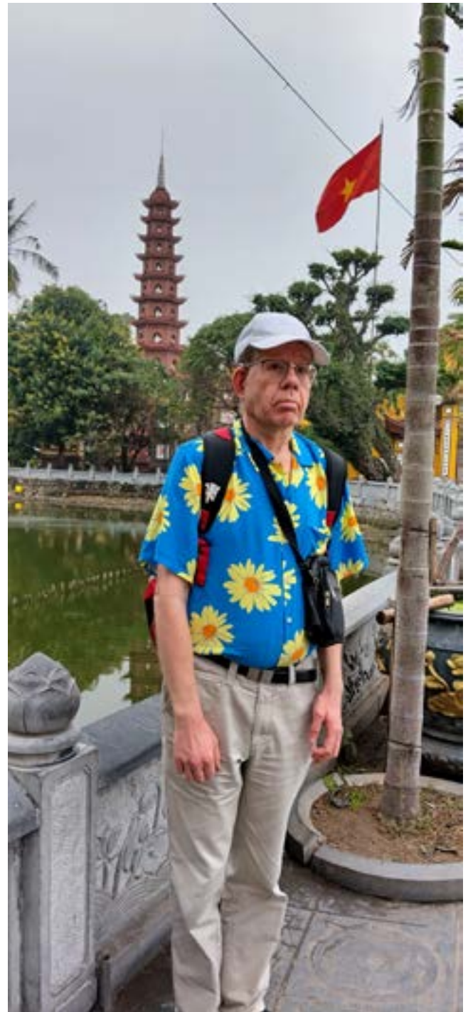
Tran Quoc on Hanoin vanhin buddhalainen temppeli.

autojen keskellä. Teiden ylitys vaikutti melko kaoottiselta, mutta kun siihen tottui, sujui sekin melko hyvin. ■