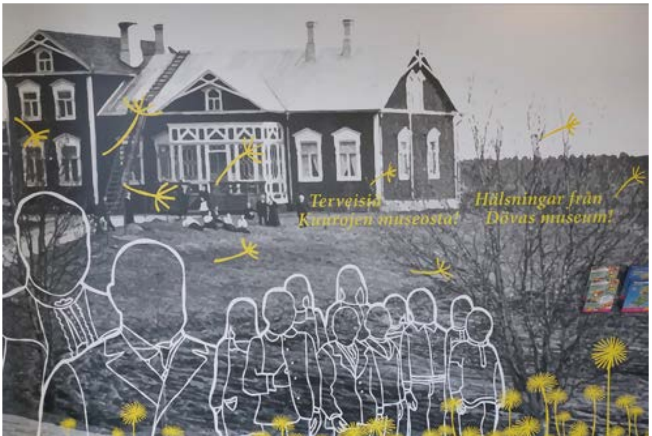
Valokuva Åvikin vanhasta rakennuksesta osana taideteosta. Tekijä: Olga Green.

Museo sijaitsee Valkealla talolla heti pääsisäänkäynnin edessä, ja se on avoinna arkisin klo 8–16. Museoon on vapaa pääsy. Jo museon ulkopuolella kävijän huomio kiinnittyy suureen mustavalkoiseen valokuvaan Åvikin vanhasta rakennuksesta. Kuvan alosaan on lisätty valkoisin ääriiviövoin ihmishahmoja, joista yksi esittää kuurosokeaa Frans Leijonia . Seinällä ja