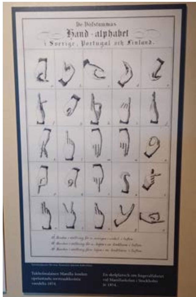
Tukholmalaisen Manilla-koulun opetustaulu sormiaakkosista vuodelta 1854

1. Kuurojen koulut. Täällä voi tutustua kuurojen koulunkäynnin historiaan. Esillä on maalaus Suomen ensimmäisestä kuurojen koulusta, jonka taiteilija Sävele Angervo ikuisti vuonna 1913. Lisäksi vitriinissä on pienoismalli Pietarsaaren kuurojen koulusta sekä opetuksessa käytettyjä välineitä,