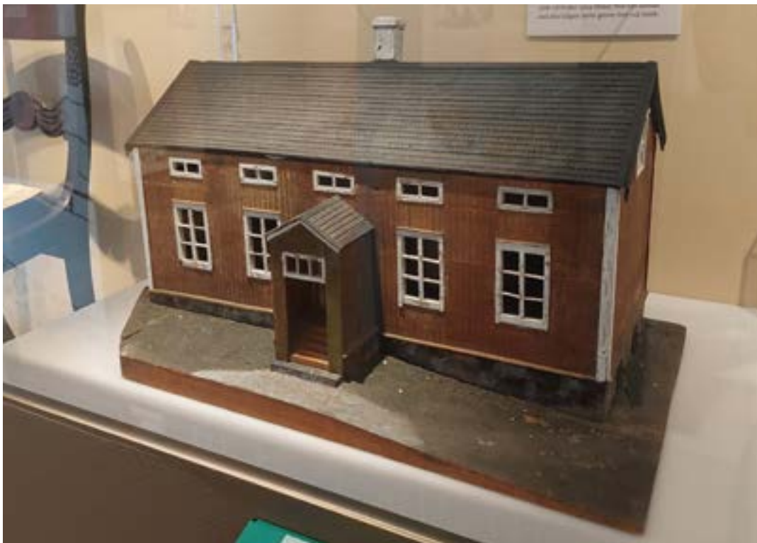
Pietarsaaren kuurojenkoulun pienoismalli.

5. Koti ja perhe. Historiallisesti kuurojen perhe-elämään on vaikuttanut lainsäädäntö. Vuoden 1929