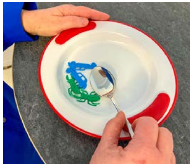
Lautanen, jossa on hahmoteltavia osia.

-Lautasessa on haptisesti eli tuntoaistilla ja liikkeellä hahmotettavia osia, jotka helpottavat ruoan paikkojen hahmottamista lautasella ja myös ruoka aineiden löytymistä. Lautasen