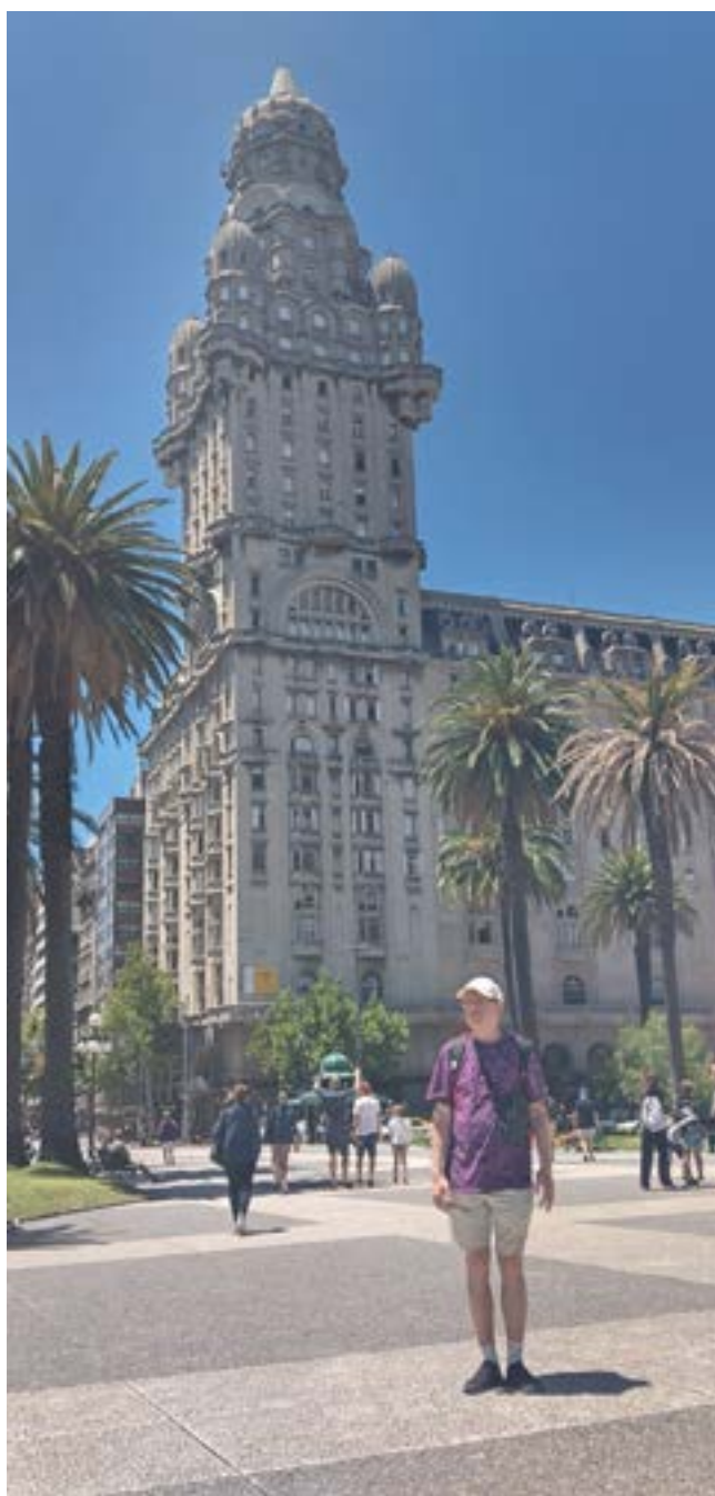
Palacio Salvo, Montevideo

takia projekti jäi kesken ja nykyisin talossa on tavallisia pienikokoisia asuntoja. Rakennuksen katutasossa sijaitsee pieni tangomuseo, joka on perustettu säveltäjä Gerardo Matos Rodríguezin ja tangomusiikin ympärille. Rodríguez on säveltänyt kenties maailman tunnetuimman tangon La Cumparsita , mikä Suomessa tunnetaan nimellä Hiljaa yössä .