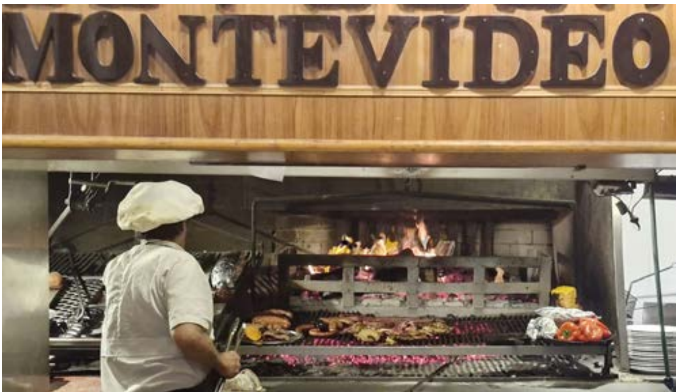
Kokki hiiligrillin parissa

Ciudad Vieja on Montevideon vanha kaupunki. Sen ytimessä sijaitsee Itse-näisyyden aukio - Plaza Independen-cia . Aukion laidalla on Palacio Salvo , joka oli aikoinaan valmistuessaan Ete-lä-Amerikan korkein rakennus. Siitä piti tulla hotelli, mutta erimielisyyksien