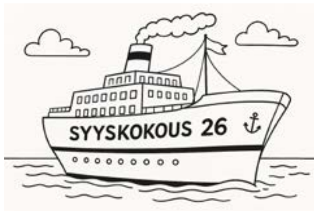
Kuvituskuva: Tekoäly Copilot.

Saat lisää tietoa risteilystä seuraavassa Tuntosarvessa huhtikuun alussa! ■