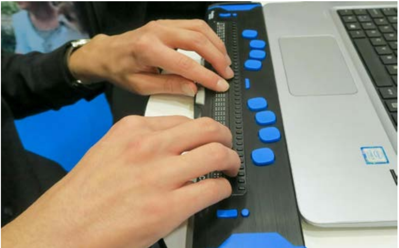
Kuvituskuva: Pistenäytön käyttöä voi harjoitella kuntoutuksessa.

https://kuurosokeat.fi/palvelut/kuntoutuspalvelut/ ■